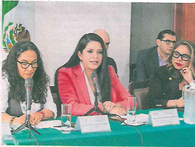
Lizette Enríquez, presidenta del Info CDMX, dijo que se requiere de una transición ordenada al nuevo modelo de transparencia en la Ciudad.

LIZETTE ENRÍQUEZ Presidenta del Info CDMX