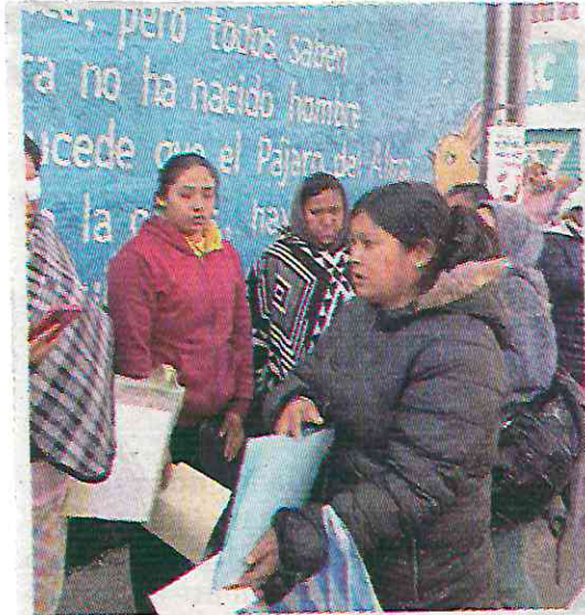
Las ignoran y no aceptan la documentación