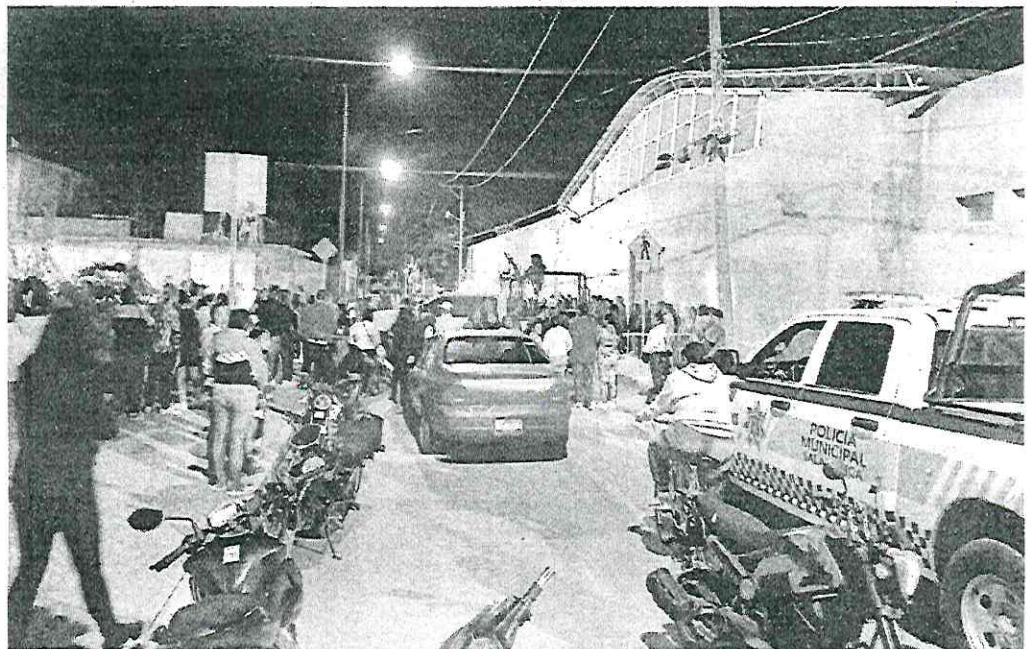
MASACRE. La noche del martes, hombres armados atacaron un anexo en la Colonia el Rosario, en Salamanca, Guanajuato, donde mataron a cuatro personas e hirieron a otras cinco.

Conforme los primeros reportes de la Alcaldía gobernada por Morena, un grupo armado irrumpió en el centro de atención a personas con adicciones y disparó contra los internos, de los cuales 4 murieron y 5 quedaron con heridas graves; en tanto, 4 personas fueron privadas de