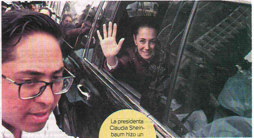
La presidenta Claudia Sheinbaum hizo un recorrido por tierra para ver las afectaciones.

“Lo más urgente es el abastecimiento de agua potable y el restablecimiento de caminos. Dejamos instrucciones a @conagua_mx y @SICTmx para ayudar al Municipio de Acapulco. Mañana tendremos otra reunión para