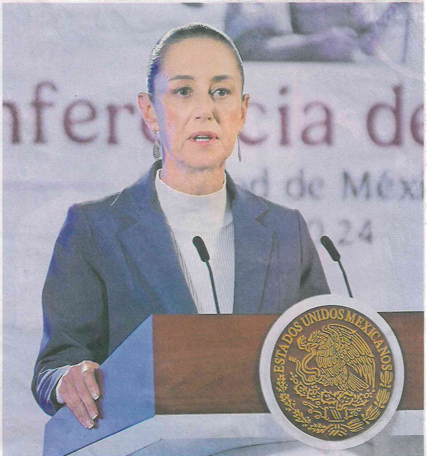
En su primera conferencia de prensa mañanera, la presidenta Claudia Sheinbaum se refirió al tema del Poder Judicial de la Federación y aseguró que justamente la reforma lo que pretende es sanearlo.