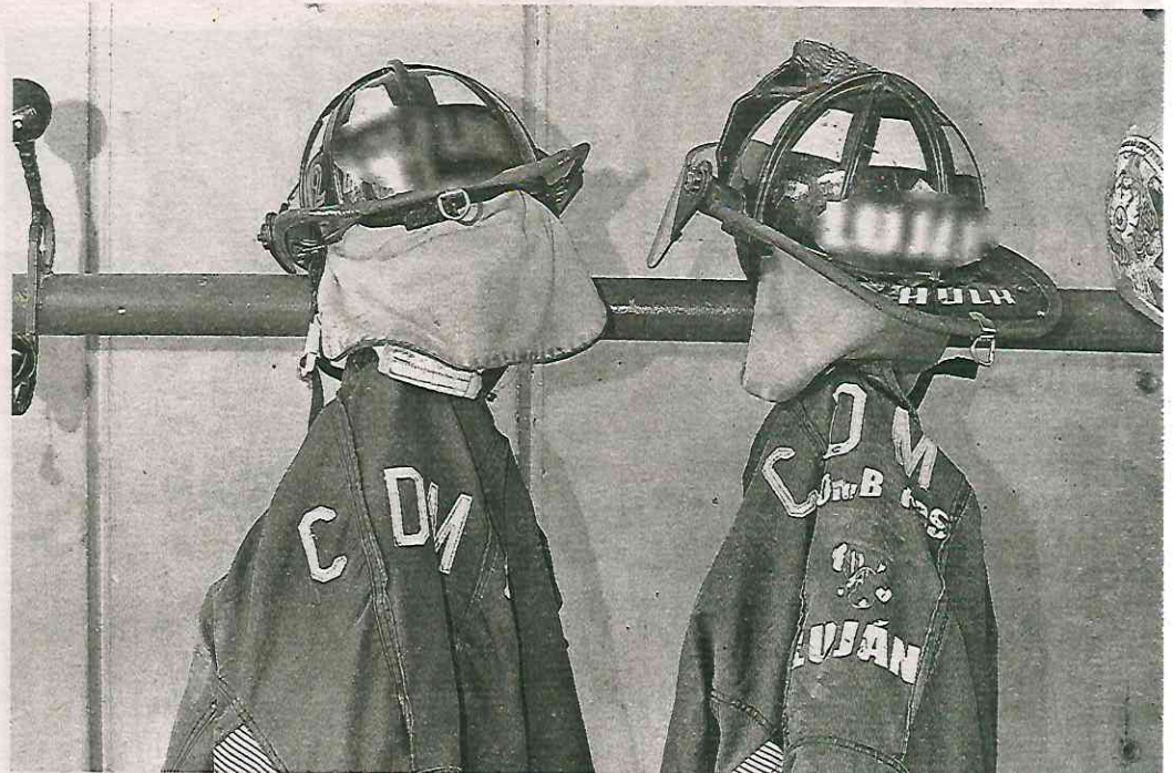
El Sindicato de Bomberos Resistencia y Libertad, de la Ciudad de México, asegura ser el titular del Contrato Colectivo de Trabajo

“Nosotros emplazamos a huelga en el CFCRL, institución que los reconoce como