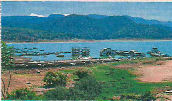
La presa de Valle de Bravo se encuentra a 27% de su capacidad, informaron autoridades.