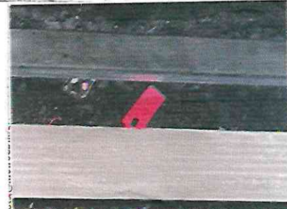
CELULAR en las vías de la estación Guerrero, de la L3 del Metro, el 16 de mayo.

Paraguas cayeron a las vías del tren en el primer semestre del año