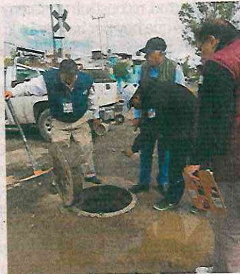
Personal de Neza y vecinos revisaron registros del suelo.

EL UNIVERSAL por Ciudad Lago, se percibió el olor a algún tipo de hidrocarburo, especialmente cuando el sol arreció en la zona. En el piso, un tipo de humedad que no tenía consistencia de agua recorría parte de la manzana.