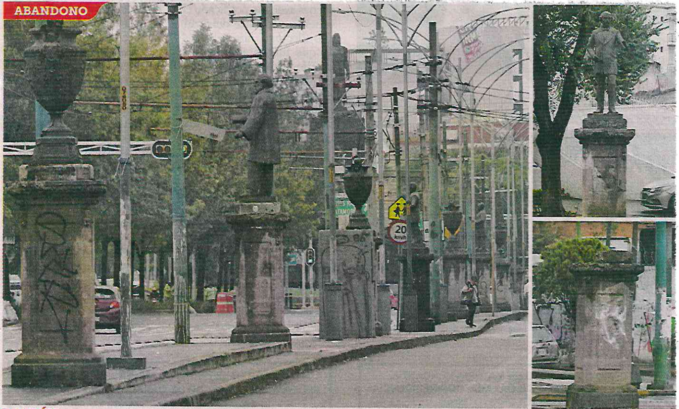
DESDÉN. Desde Avenida Hidalgo hasta Manuel González, las efigies y los jarrones lucen en completo abandono.