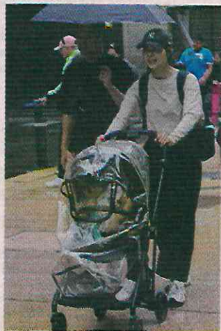
Entre enero y junio habían acumulado 161.9 milímetros.

De enero a junio se habían acumulado 161.9 milímetros de lluvias en la CDMX,