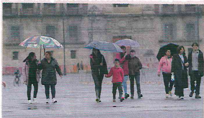
De acuerdo con el OCAVM, en junio hubo 104.4 milímetros de lluvia, mientras que el año pasado 28.2 milímetros