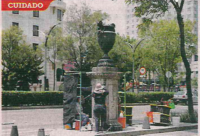
■ En mayo se restauraron las que están en la zona turística del icónico Paseo de la Reforma.

“Es nuestro paso de Reforma, se tiene que ver impecable”.