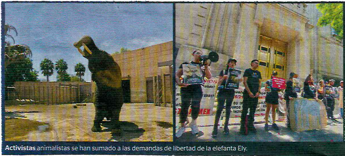
Activistas animalistas se han sumado a las demandas de libertad de la elefanta Ely.

Lo anterior, revela que la Sedema no estableció requisitos para contratar al personal de zoológicos, pero gracias a que los trabajadores de estructura sí contaban con la experiencia en el bienestar animal de los ejemplares de fauna silvestre, los recintos pudieron operar.