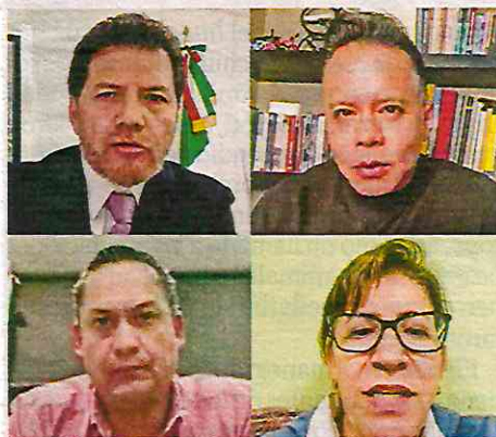
SESIÓN. De los 8 dictámenes presentados, 3 fueron desechados por incumplir con lo establecido en la ley local.

Por lo que los predios de Calle Sindicalismo número 3 en la colonia Hipódromo Condesa, en la alcaldía Cuauhtémoc; Sierra Mojada número 327, colonia Lomas de Chapultepec III Sección y Montes Urales número 360, colonia Lomas de Chapultepec, en la alcaldía Miguel Hidalgo no recibieron el aval para la modificación del uso de suelo. /24HORAS