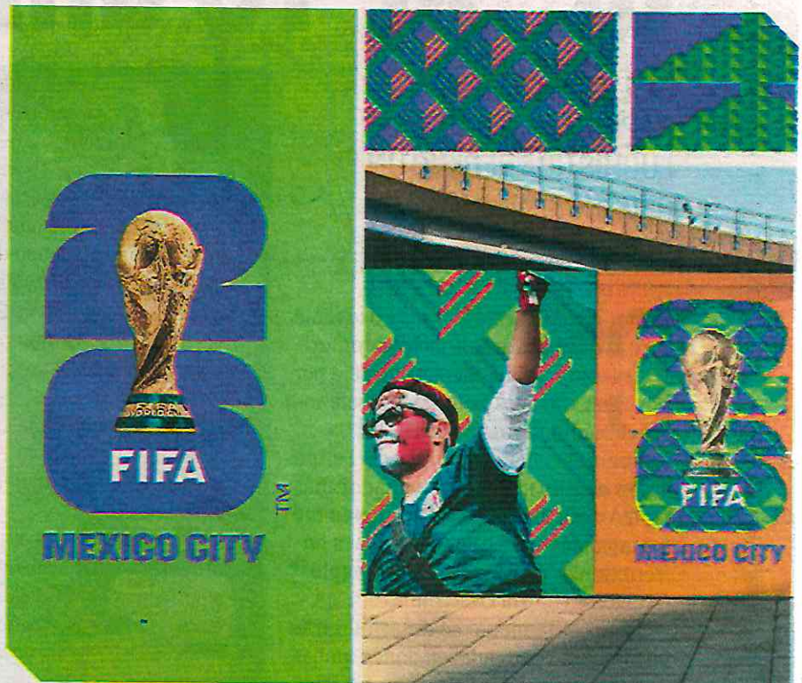
Muchos desafíos deben enfrentar el comité organizador de la Ciudad de México del Mundial 2026. especial

Uno de los principales retos es la crisis hídrica, lo que ya ha traído importantes problemas de abasto de agua en algunas zonas de la ciudad. Según datos proporcionados por la Comisión Nacional del Agua (CNA) el sistema hídrico Cutzamala, que suministra el 27% del agua de la capital se encuentra al 30% de su capacidad, es decir, en uno de los niveles más bajos de su historia. Y ante la llegada de turistas, depor-