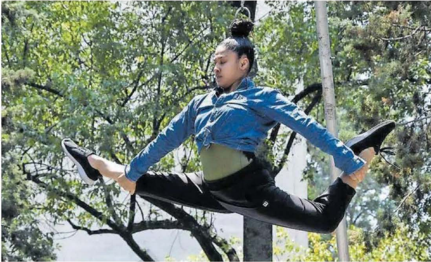
Durante la manifestación demostraron sus habilidades.