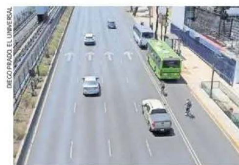
Expertos piden implementar medidas de seguridad y analizar la funcionalidad de la ciclovia.

"Yo creo que puede ser riesgoso y habría que analizar qué tanta afluencia va a tener, ya que las ciclovias por Periférico se ven vacías", dijo.