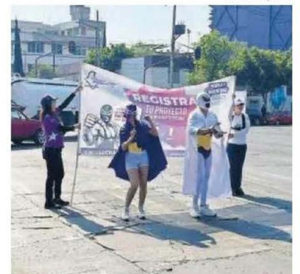
EL IECM promoviendo la participación.