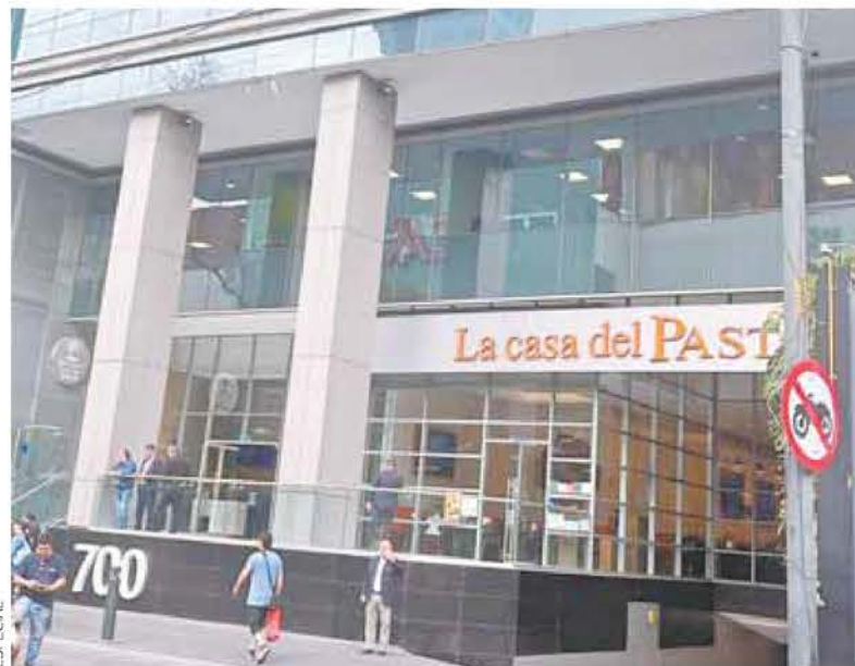
Este predio se localiza en Insurgentes #700 y la calle Luz Saviñón.

“Los que lo vivimos y luchamos en ese momento sabemos de la magnitud y la gravedad de ese suceso. Por lo mismo este próximo domingo 6 de abril a las diez de la mañana, los estamos convocando a que como comunidad nuevamente nos paremos juntos en Xola e Insurgentes para pedir se desclasifique la información re-