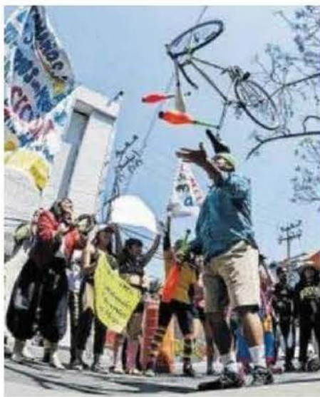
Parte del espectáculo de protesta.

Y es que además acusan incumplimientos y reducciones presupuestales por parte de la dependencia tales como la publicación de la convocatoria 2025/26, la reducción de sueldos a los docentes y falta de los mismos y la adquisición de equipo pedagógico. En respuesta, la Secretaría defendió que desde 2016 ha otorgado un