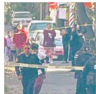
El crimen sucedió en Tlalpan.

“Fue literalmente enviado a la congeladora, porque dijeron literalmente que se podrían interpretar de manera errónea”, enfatizan los denunciantes.