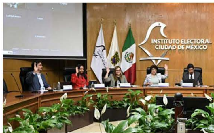
Instituto Electoral de la Ciudad de México.

En el caso de las personas en prisión preventiva, el SEI se precargará en tabletas electrónicas que funcionarán sin conexión a internet dentro de los