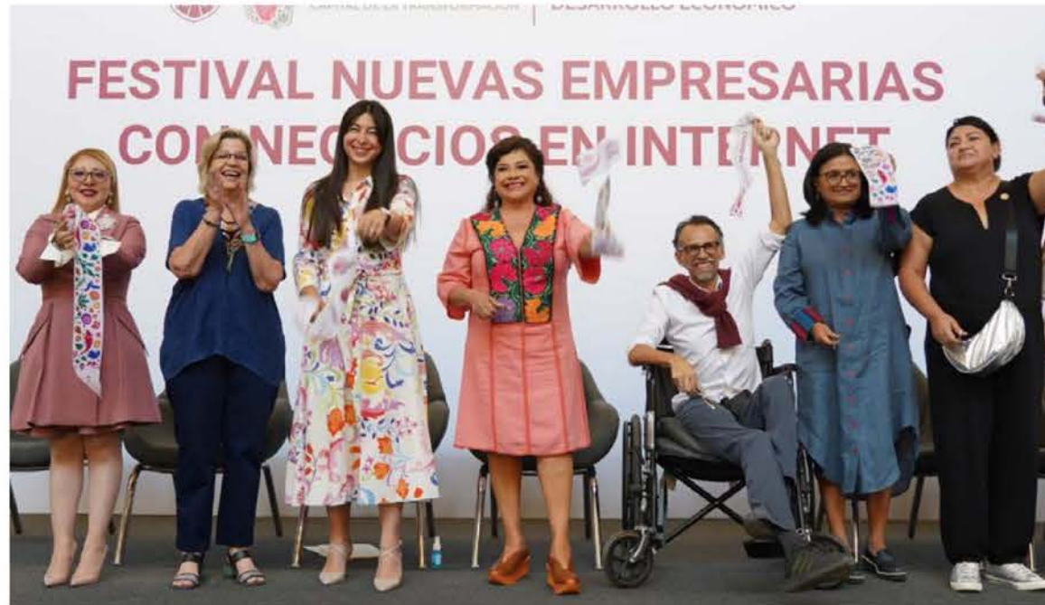
La jefa de Gobierno de la CDMX inauguró el primer Festival de Nuevas Emprendedoras con Negocios en Internet (NENIS), celebrado en el Museo Yancuic.

“Ustedes han desarrollado un comercio digital, donde no es necesario vernos totalmente. Eso es romper estereotipos, de lo que nos decían que debería ser y lo que ustedes están haciendo. (...) El gran objetivo es que las mujeres en la Ciudad de México tengan autonomía eco-