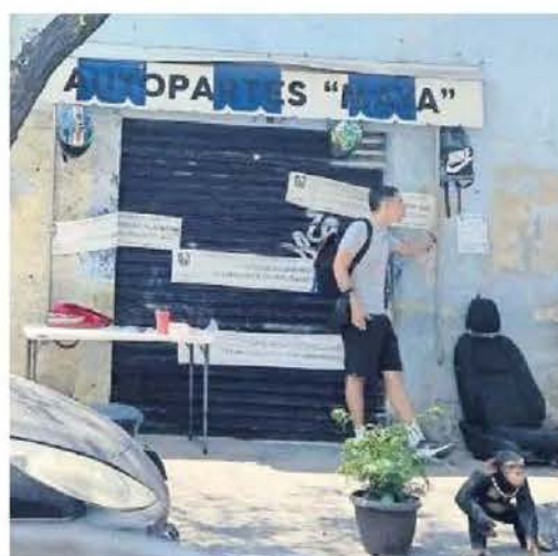
Las autopartes son colocadas en mesas de plástico para ser mostradas, frente a negocios clausurados.

Las autopartes son colocadas en mesas de plástico para ser mostradas, esto frente a los sellos de clausura, como es el caso del comercio