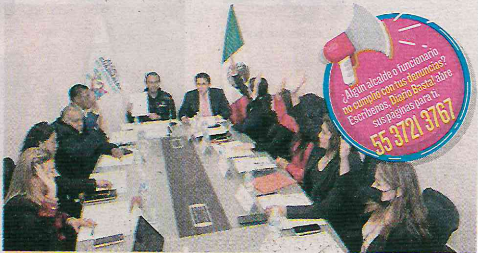
El sueldo mensual de cada uno asciende a 35 mil pesos

Durante diciembre una de las solicitudes más comunes por organizaciones vecinales es el del servicio de recolección de basura, pues en varias colonias como San José de los Cedros, han dejado de pasar los camiones colectores a pesar de que los festejos decembrinos aumentan la generación de residuos. También se ha reportado que en parques, jardines y fuera de las escuelas públicas