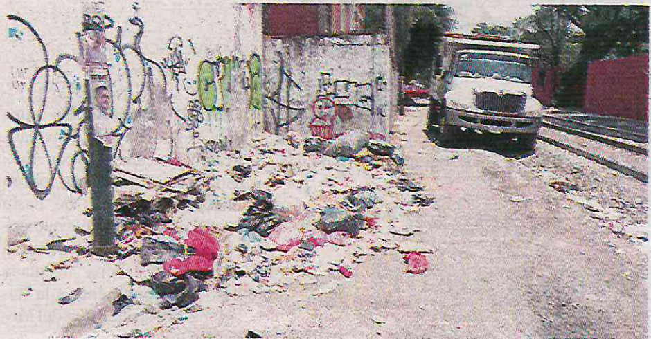
La anterior administración entregó la demarcación con 22 tiraderos clandestinos