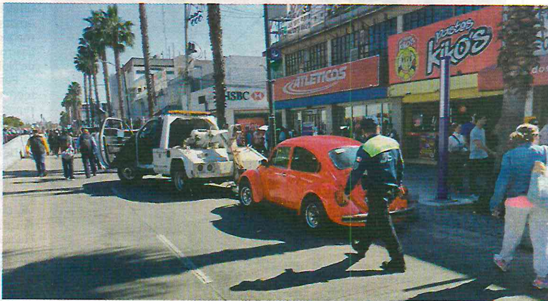
Automóviles retirados en Gustavo A. Madero.

“Sí son más patrullas, sí son más elementos de seguridad, pero también es que la autori-