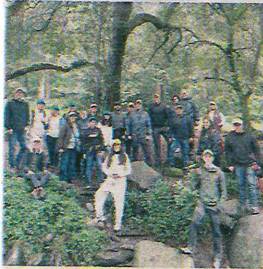
Firmas participan en "acciones ecológicas"