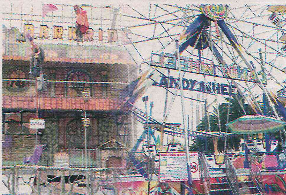
Los encargados de las atracciones acusaron que están amenazados

Algunos encargados de estas atracciones, que se instalaron desde mediados de diciembre, comentaron a Diario Basta! que están amenazados de que se les impida seguir en la feria