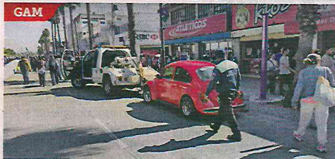
■ En grúa o por sus dueños, 567 autos abandonados en vía pública han sido retirados en ambas alcaldías.