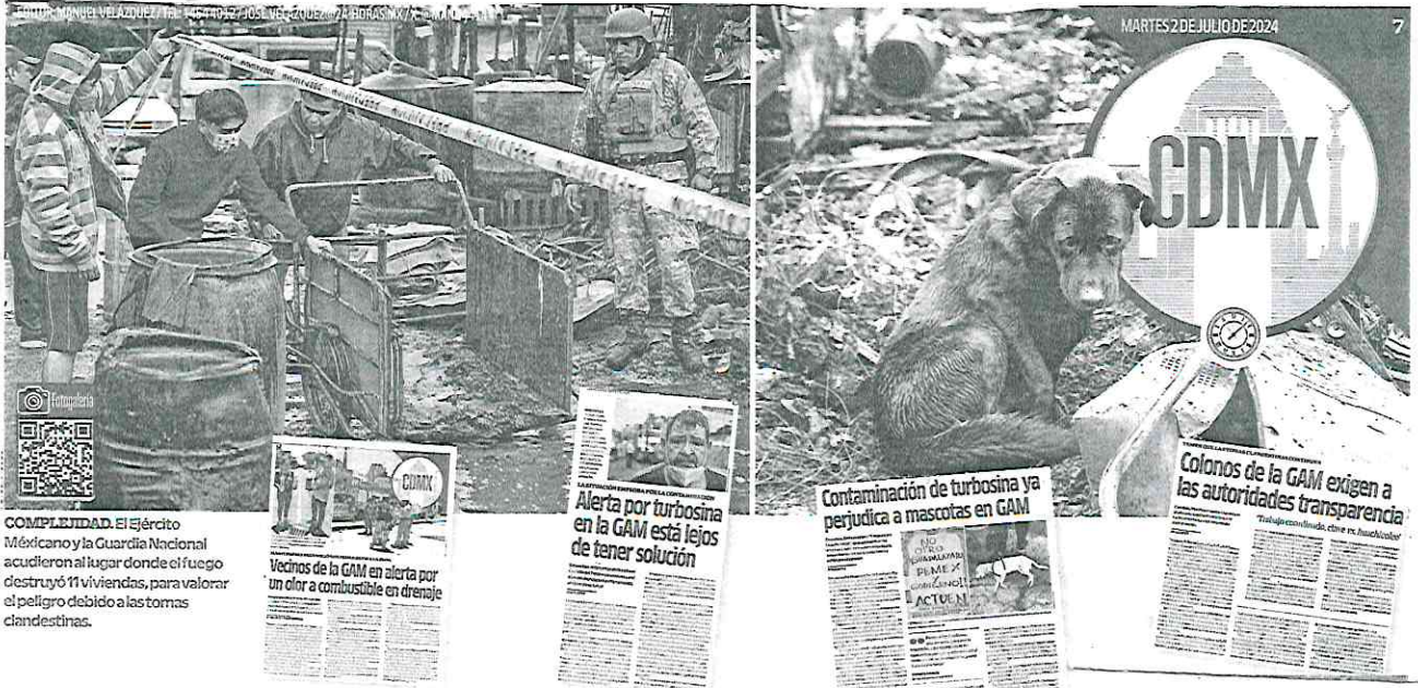
COMPLEJIDAD. El Ejército Mexicano y la Guardia Nacional acudieron al lugar donde el fuego destruyó 11 viviendas, para valorar el peligro debido a las tomas clandestinas.