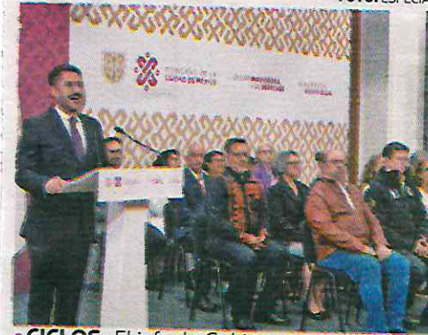
• CICLOS. El jefe de Gobierno ya trabaja en sus últimos 100 días de mandato.