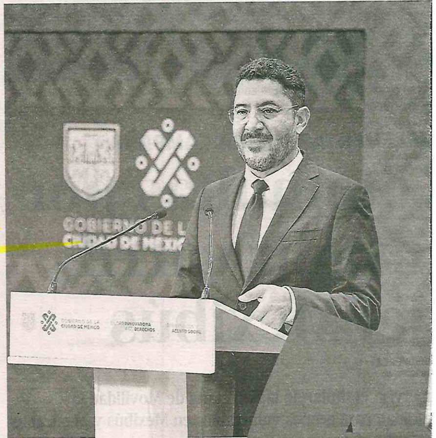
El jefe de Gobierno, Martí Batres, anuncia entrega de obras en sus últimos 100 días de gestión

También presentará los primeros avances en el Sistema de Cuidados para el Bienestar de la Ciudad de México y entregarán reconocimientos a las abogadas que apoyan a las mujeres víctimas de violencia.