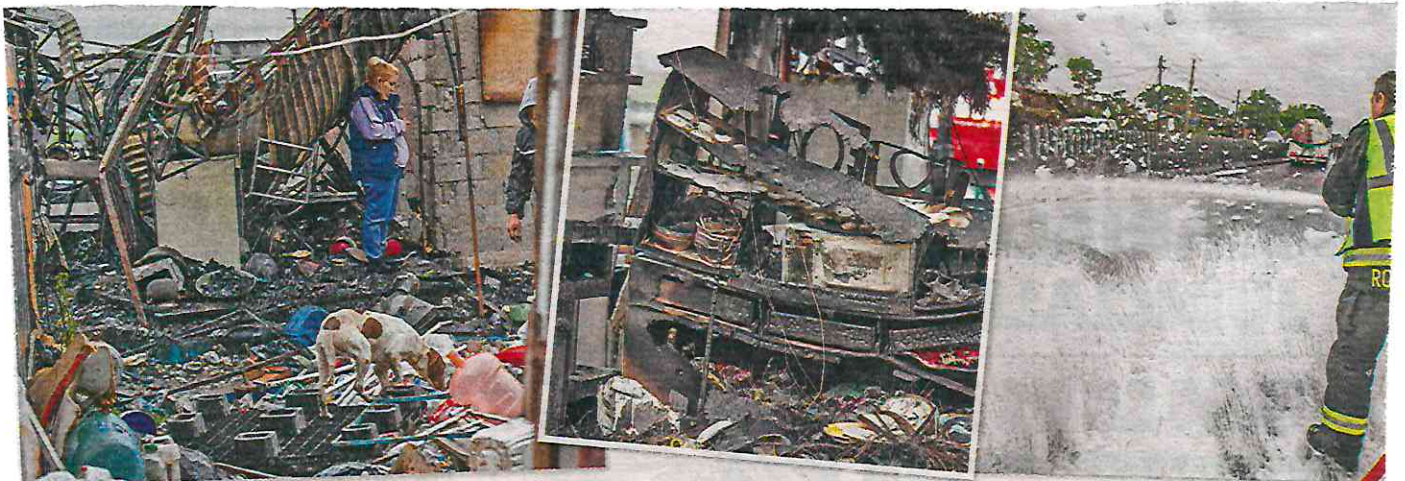
SALDO. Habitantes en la colonia Ciudad Lago, en el municipio de Nezahualcóyotl, Estado de México, perdieron todo por el incendio de este lunes.

● 1 de julio de 2024. Un incendio, provocado por el diesel derramado de una pipa que se volteó en los límites de la colonia Ciudad Lago, Nezahualcóyotl, y la alcaldía Gustavo A. Madero, destruyó 11 casas irregulares y causa alarma entre los vecinos de la zona donde se detectó el huachicoleo de turbosina.