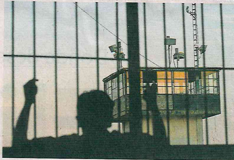
Detener de forma automática a las personas desincentiva la capacidad para investigar delitos e incumple sentencias, alertó la ONU-DH.

En noviembre pasado, la ONU-DH afirmó que la reforma sobre prisión preventiva aprobada en la Cámara de Diputados es regresiva y perjudicial, además