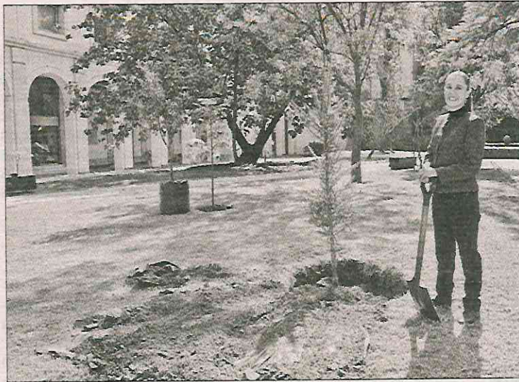
▲ El último día de 2024, la Presidenta plantó una Abies religiosa en Palacio Nacional.

En un video compartido la noche del 31 de diciembre, en el que se le vio sembrando una conífera en uno