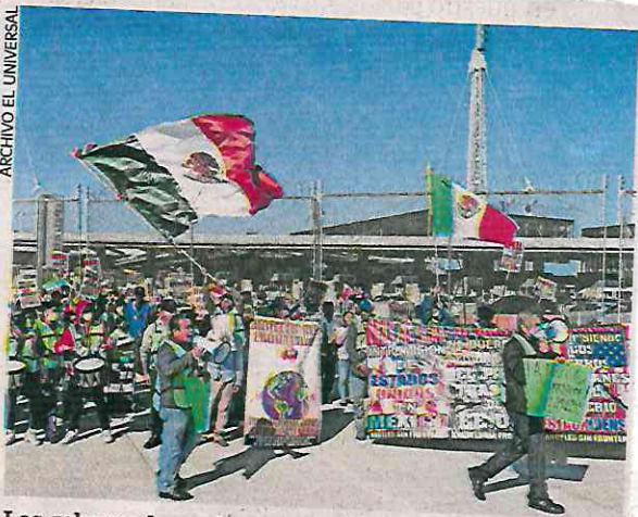
Los gobernadores de Morena respaldan el apoyo de Sheinbaum a los mexicanos que viven en EU.

“La atención a la migración solamente puede darse a través de la colaboración para el desarrollo, el invariable respeto a la soberanía de nuestros países y, por supuesto, la defensa de los derechos humanos de todos los mexicanos que residen en el extranjero”, dijeron los gobernadores guinda.