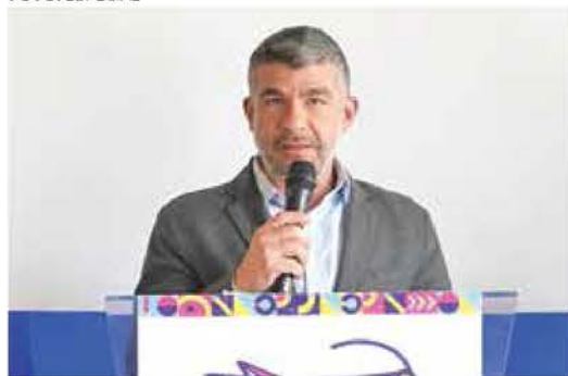
• DATOS. El alcalde informó el dispositivo.