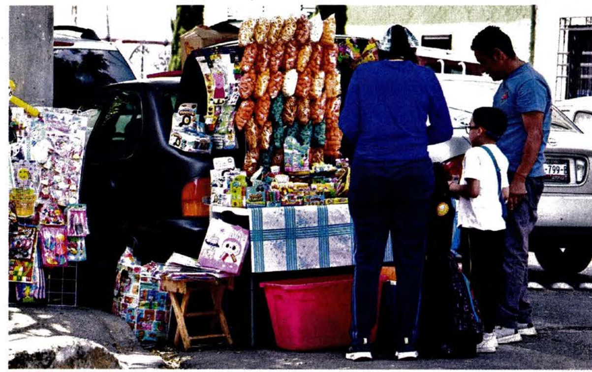
EXCESO DE TODO. Al exterior de la Primaria Juan Antonio de la Fuente, en GAM, abundan los puestos de comida chatarra.

Puedes reportar fugas de agua en la vía pública a través de la línea H2O del CS: *426.