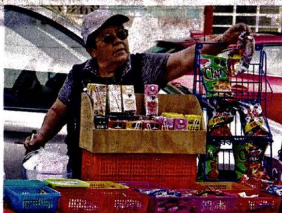
En la Primaria Ramón López Velarde, también en GAM, continuó la venta de alimentos poco saludables.

Pero como ocurre siempre, a la hora de la salida se instalaron los puestos libres