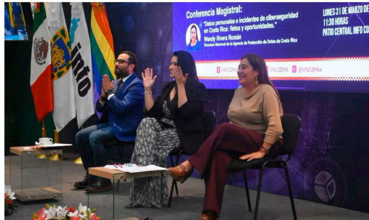
La iniciativa fue presentada durante un foro, en compañía de legisladores locales.

Expresó que el papel de las y los diputados de Morena en el Congreso capitalino será esencial para que la iniciativa de ley sea aprobada a la brevedad.