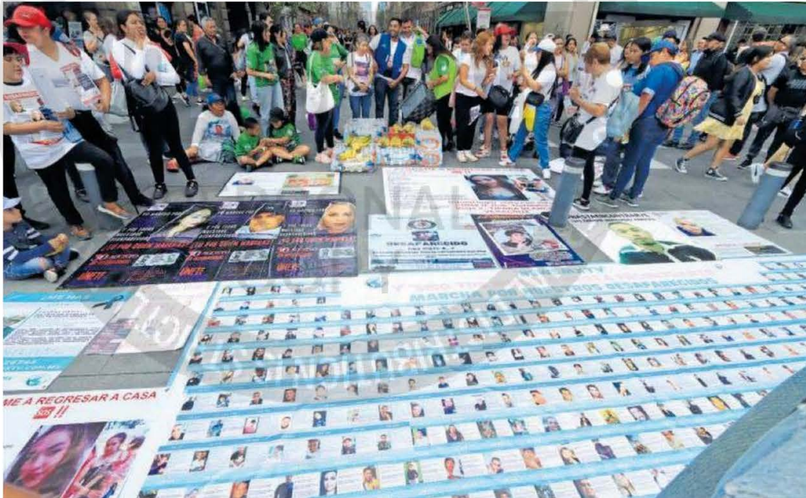
Las madres buscadoras han reclamado la falta de atención en cada uno de sus casos