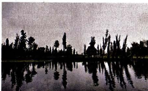
Detrás de los ahuejotes que bordean el canal está el lugar donde se planea llevar a cabo el festival musical.

“Desprecian a las 15 mil personas que participan con donativos en la campaña AdopAxolotl y a todos quienes compran la producción de las chinampas”, lamentó Zambrano.