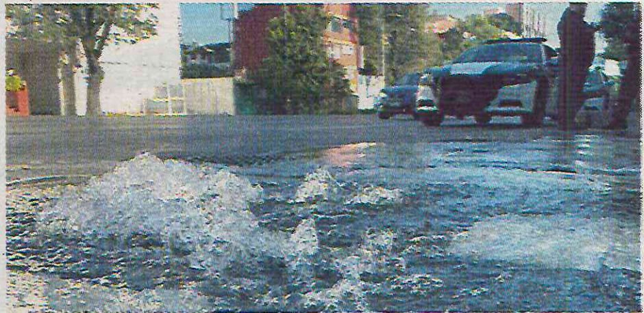
Además ocurren por factores como el desgaste de las tuberías y la actividad sísmica

La recuperación se debió a las abundantes lluvias, pero esta cifra aún está lejos del nivel histórico promedio del 62.2%.