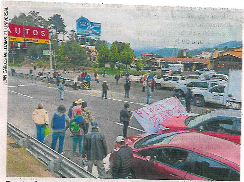
Tras una hora y media de negociación con autoridades, ejidatarios de Ocoyoacac determinaron el cierre de la autopista.