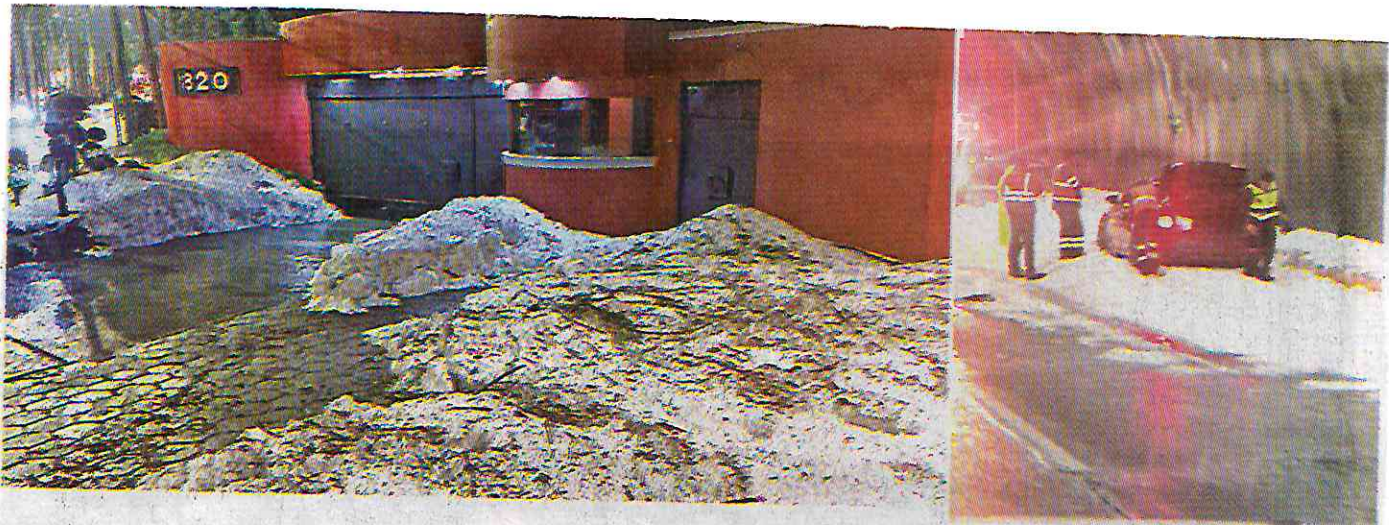
La calzada de Las Águilas y la Supervía Poniente resultaron afectadas por la acumulación de granizo de hasta 30 centímetros.

Al corte de las 20:00 horas, el Sistema de Aguas de la Ciudad de México (Sacmex) había atendido 20 reportes de inundación.