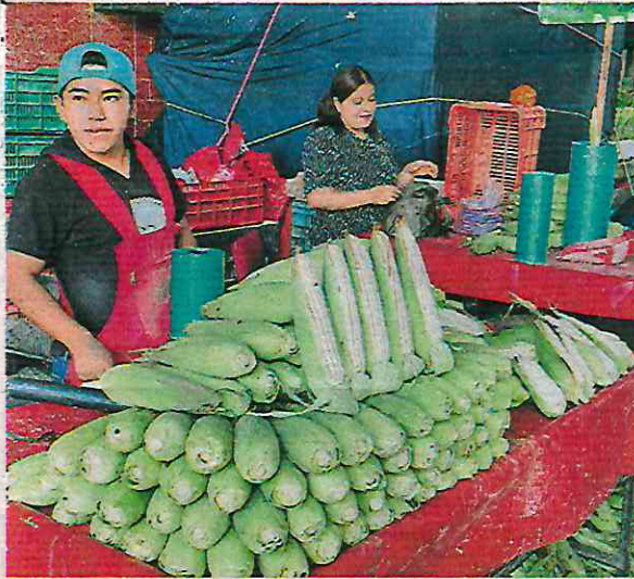
La Central de Abasto, sede de la primera venta y degustación especial de elotes con productores

“Estamos pensando que esta fiesta debe durar más días. Yo creo que para la tercera edición, en el 2025 lo vamos a hacer viernes, sábado y domingo, para que todas las familias mexicanas puedan venir con más tiempo a consumir este producto”