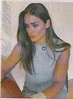
■ La Alcaldesa electa compareció ayer ante magistrados del Tribunal.

La Alcaldesa electa también compareció ayer ante los magistrados del Tribunal Electoral en una videollamada para pedir que se respete el resultado del 2 de junio.