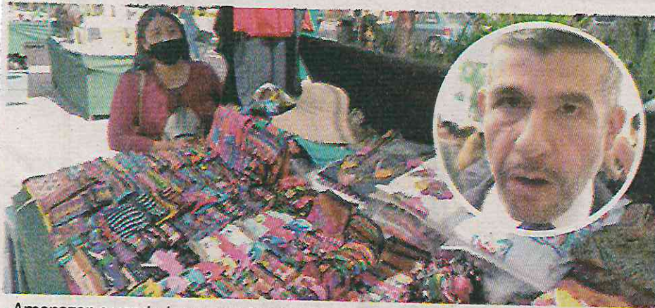
Amenazan a vendedores con clausurarlos si no cumplen con las cuotas

Los comerciantes instalados en Chapultepec afirman que pagan hasta 150 pesos a personal de la alcaldía para que los dejen abrir