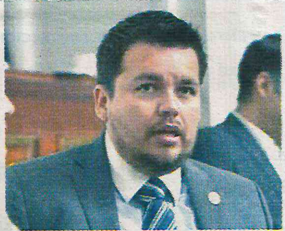
· Se percibe un claro intento de protagonismo

Entre sus propuestas, destaca la creación de una Tarjeta Migrante que permitiría a las familias de chilangos en el extranjero acceder a beneficios