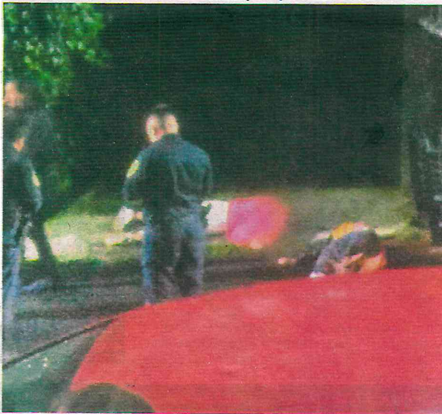
La mujer quedó boca abajo en la acera y el hombre tirado de lado sobre la calle

ron a una mujer que estaba boca abajo sobre la acera y al hombre tirado de lado sobre la calle.