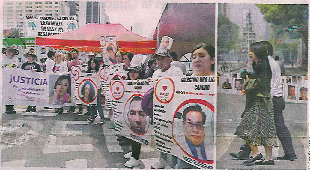
■ Año con año, en la Glorieta de los Desaparecidos se escuchan dos preguntas a manera de consignas: ¿dónde están? y ¿por qué sólo nosotros los buscamos?

Intentan localizar a sus familiares y lo único que encuentran es la falta de interés de las autoridades; cada año se reúnen para recordar a quienes no han vuelto