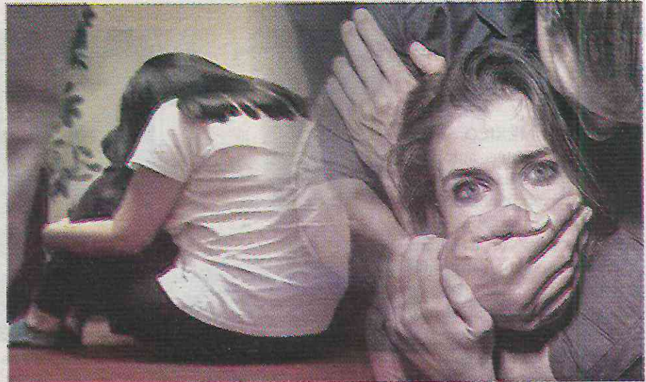
Se contemplan en estos crímenes, el abuso sexual, el acoso, la violación, y pederastia

Las estadísticas de la FGJCM, contemplan en este tipo de delitos el abuso sexual, el acoso, la violación, y casos de