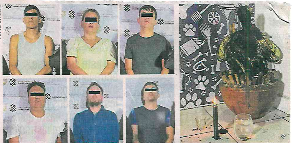
Luego de una investigación que duró tres meses, agentes de Inteligencia detuvieron a seis operadores de El Perro Salado, quienes se protegían con santería.