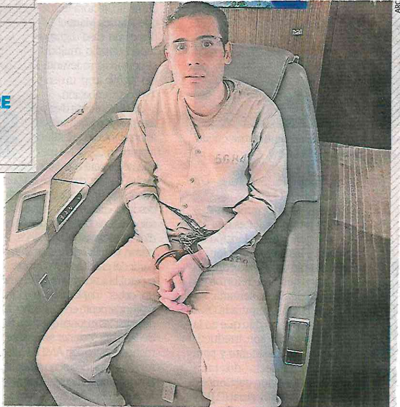
En septiembre pasado fue extraditado a EU al ser considerado como uno de los narcos más buscados por ese país por su participación en el tráfico de fentanilo.

DE SEPTIEMBRE de 2023 El Ratón fue extraditado a suelo estadounidense.