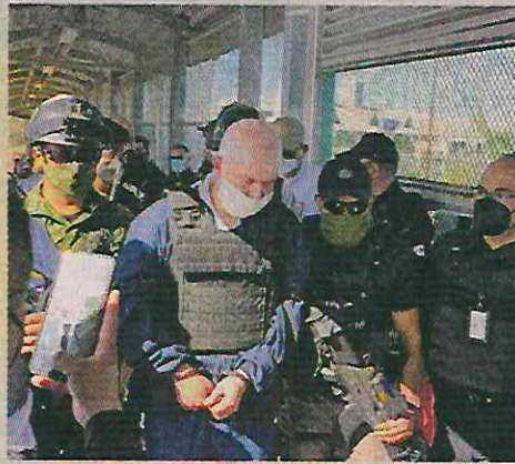
Eduardo Arellano Félix, "El Doctor"

Narcotraficantes que cumplieron su condena en EU y fueron deportados a México: