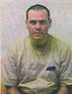
Vicente Zambada Niebla, “El Vicentillo”