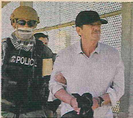
Héctor Palma Salazar, "El Güero Palma"