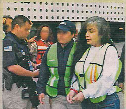
Sandra Ávila Beltrán, "La Reina del Pacífico"