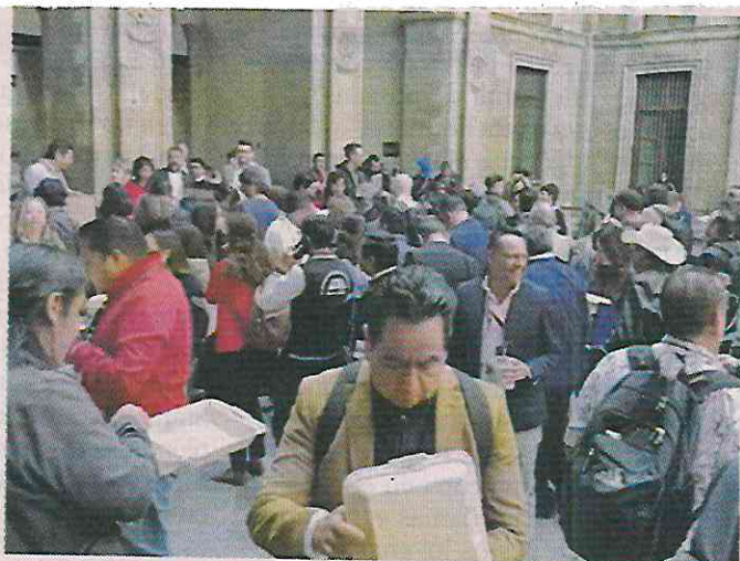
■ Tras la Mañanera, los youtubers recibieron en charolas de unicol huevo a la mexicana con un bolillo en Palacio Nacional.

“La Presidenta le va a dar continuidad con su libertad, con los cambios, porque son otras circunstancias, y de manera soberana, porque va a representar al pueblo de México, va a continuar con esta lucha por la libertad, por la justicia, por la democracia, por nuestra soberanía y yo estoy seguro de que se va a seguir impulsando el que se consolide las comunicaciones a través de las redes sociales y que se consolide el periodismo independiente, alternativo, nosotros no queremos a un periodismo sometido, vendido”, dijo.