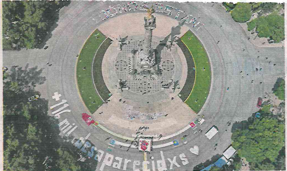
En el Ángel de la Independencia, colectivos alzaron la voz por las personas desaparecidas.

A la resistencia por encontrar desaparecidos y reclamar a la Secretaría de Gobierno (Segob) su borrado de los censos nacionales, se sumó desde hace una semana un grupo de madres que, aunque enfermas, se encuentran instaladas en el asta de la Bandera Monumental del Zócalo, a