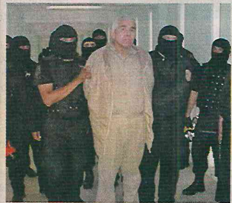
Miguel Ángel Caro Quintero