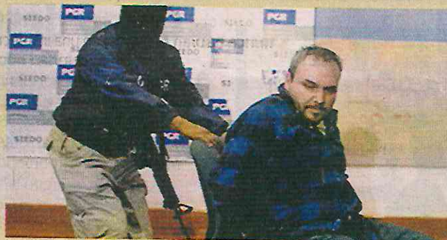
Jesús Zambada García, “El Rey”

Narcotraficantes que salieron de prisión en EU y no fueron deportados: