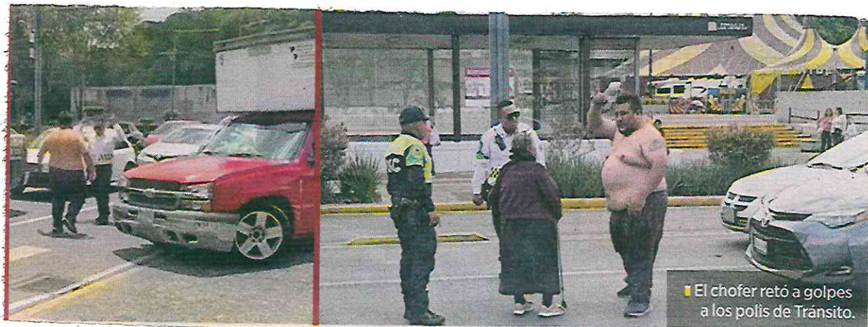
El chofer retó a golpes a los polis de Tránsito.

Al final, cada uno de los involucrados se fue por su lado.