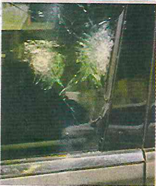
■ "El Patrón" es acusado por orquestar el ataque.