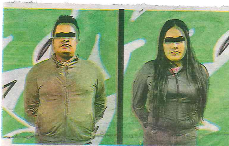
El Diez , integrante de La Unión Tepito, fue detenido por elementos de la SSC

ESTARÍA RELACIONADO con homicidio, secuestro, extorsión, tráfico de armas y venta de drogas