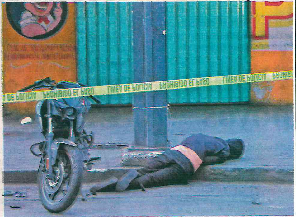
Un biker quedó muerto luego de ser arrollado por un automovilista al que presuntamente asaltó; el conductor del Mazda quedó detenido

De acuerdo con los primeros reportes un sujeto a bordo de una motocicleta Pulsar