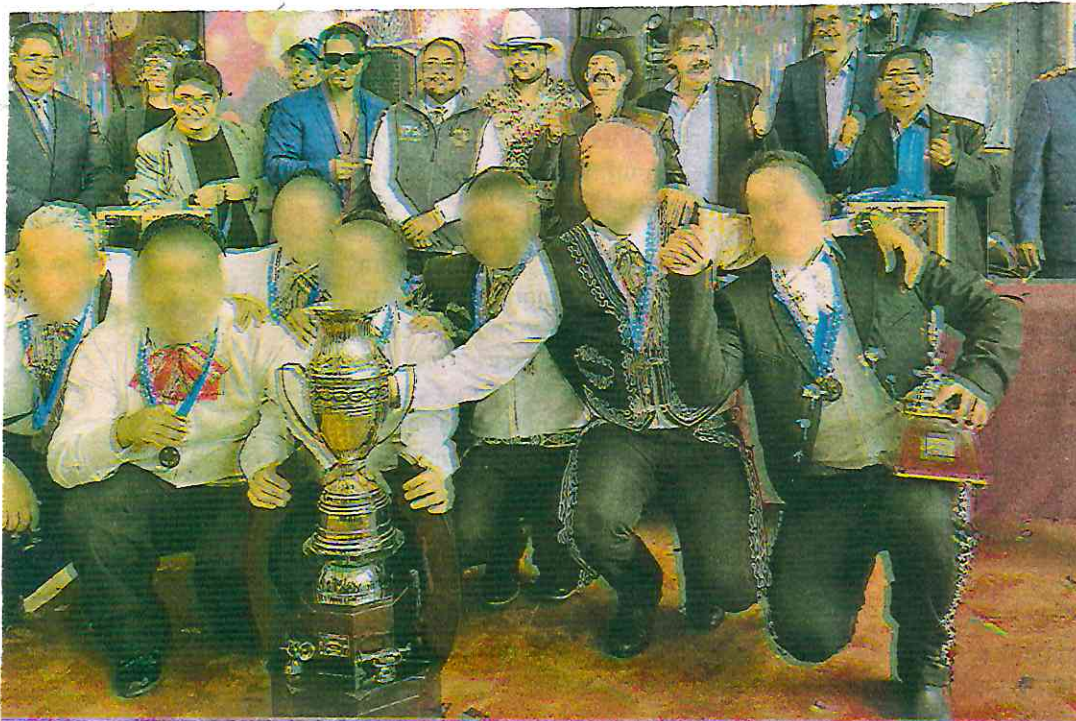
Chavos del Ocho y David García obtuvieron el primer lugar del 11 Concurso La Voz Penitenciaria

Cabe señalar que el objetivo de este certamen, es que las personas privadas de la libertad muestren su talento musical, a través de una sana competencia, con la motivación del premio al primer lugar que es grabar un disco de forma profesional y que esto contribuya en su reinserción social.