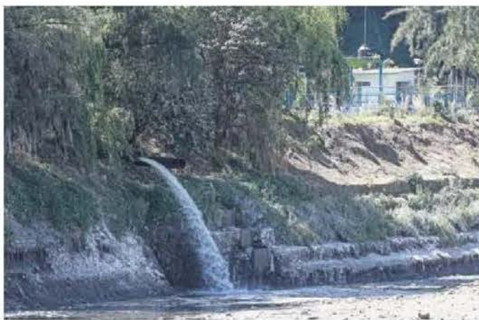
En la presa se juntan toneladas de excremento de los habitantes de miles de casas y desarrollos inmobiliarios que de forma ilegal vierten sus descargas.

2 COLECTORES de 150 y 80 metros prevé construir el municipio de Huixquilucan, con una inversión de 8 mdp.