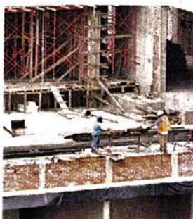
La PAOT determinó que en el predio se realizó un derribo sin dictámenes.

También pidió a la entonces Seduvi reportarle si había emitido un deslinde del terreno particular respecto a la superficie protegida del Bosque Urbano de Chapultepec. “Informó a esta entidad que no existe antecedente