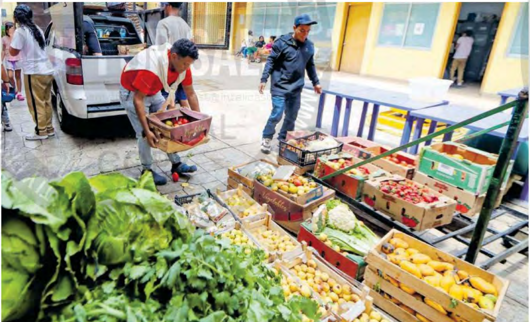
Los migrantes realizan hasta ocho viajes al día para recolectar la comida necesaria para toda la semana