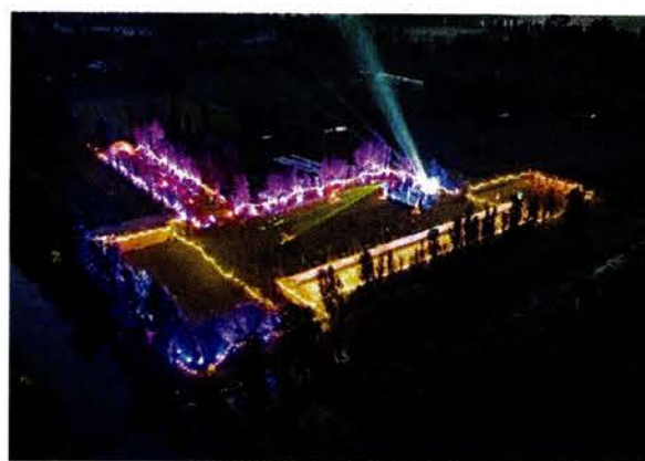
La empresa a cargo del rave ilegal ha realizado eventos en la zona chinampera desde 2022.

Destacó que una de las características de la zona chi-