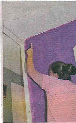
■ Habitantes del edificio temen por los daños y los sismos.