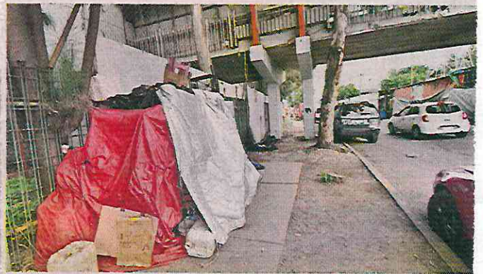
Autoridades habían prometido un ordenamiento del comercio, que nunca llegó.