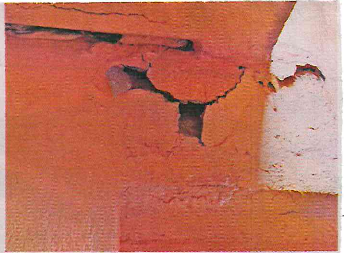
■ Vecinos de la Unidad Habitacional El Rosario, en Azcapotzalco, señalaron que hay grietas y humedad.