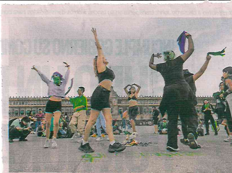
Colectivos se reunieron en el Zócalo capitalino en un mitin por el Día de la Acción Global por el Aborto Legal y Seguro.

Veracruz, Puebla, Guerrero, Oaxaca y Quintana Roo), las mujeres subrayaron que también hay retrocesos para el movimiento.