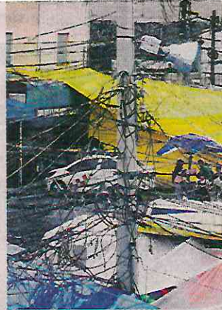
■ “Diablitos” en el mercado Sonora, de la CDMX

También se informó que desde dicho año y hasta 2022 se destinarían unos 700 millones de pesos para abatir este delito, cometido en al menos 10