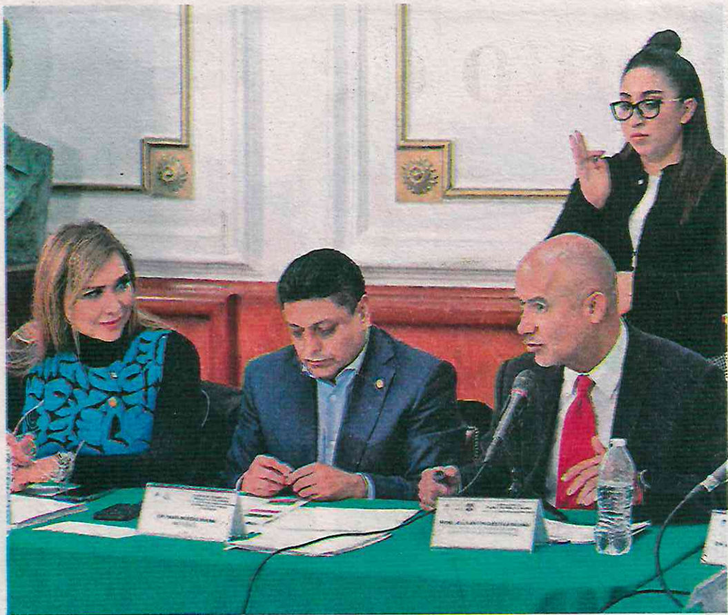
El funcionario delineó que se ha hecho una revisión a fondo de la Línea 3 y está garantizada su seguridad estructural

ce un trabajo preventivo sobre la formación de socavones, para ello, sugirió la adquisición de más georadares y desarrollar un trabajo coordinado con la Secretaría de Protección Civil para hacer recorridos.