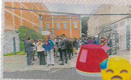
ALBERTO ACOSTA. EL UNIVERSAL