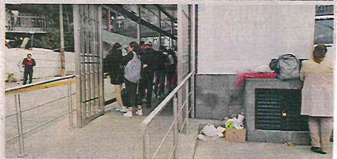
Los tiraderos clandestinos son visibles en varios puntos.