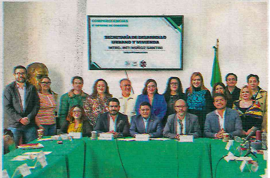
La comparecencia fue ante las Comisiones de Desarrollo e Infraestructura Urbana, de Vivienda, de Planeación del Desarrollo y de Ordenamiento Territorial