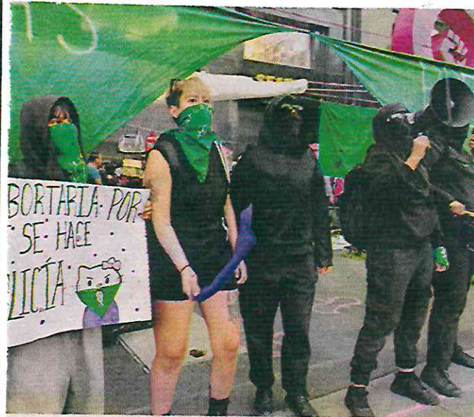
Ayer se conmemoró el Día por la Despenalización del Aborto.