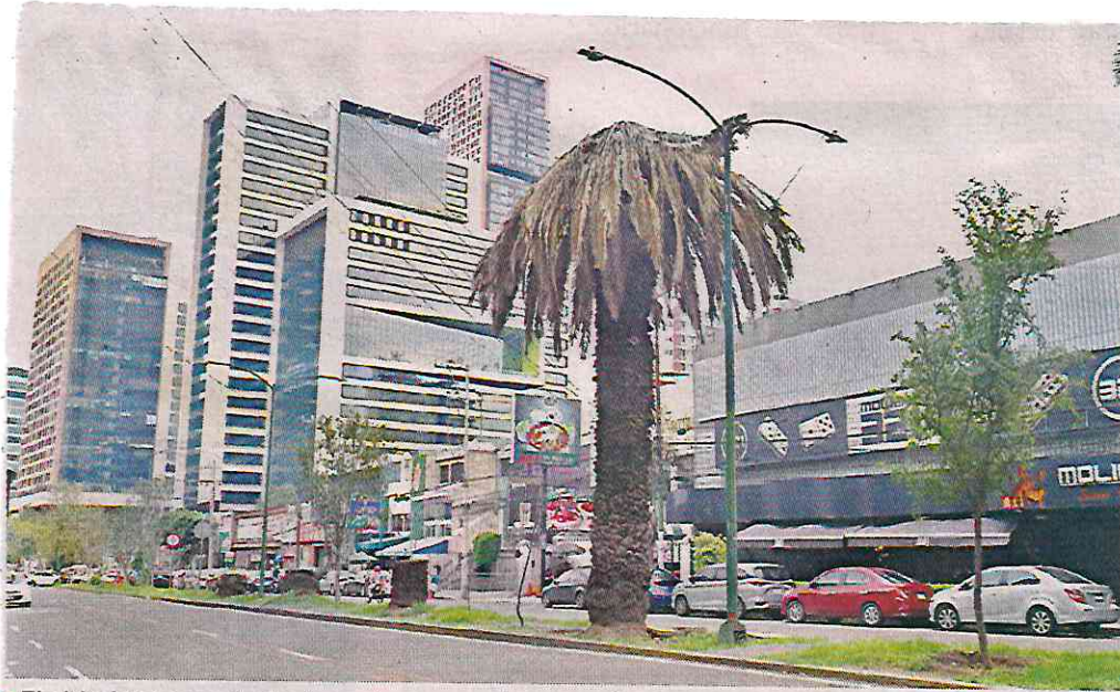
El objetivo es que todos los colonos puedan consultar la base de datos.