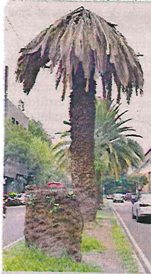
Vecinos esperan tener el censo del arbolado para diciembre.

Mayte de las Rivas, de la Voz de Polanco