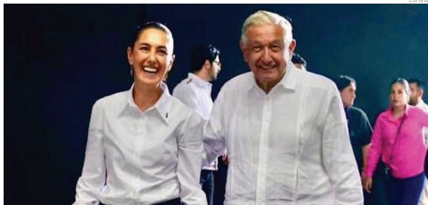
Claudia Sheinbaum junto al presidente López Obrador en su penúltima gira juntos.

Horas antes de colocarse la banda presidencial como la primera Presidenta de México, el próximo 1 de octubre, Claudia Sheinbaum tendrá una cena con jefes