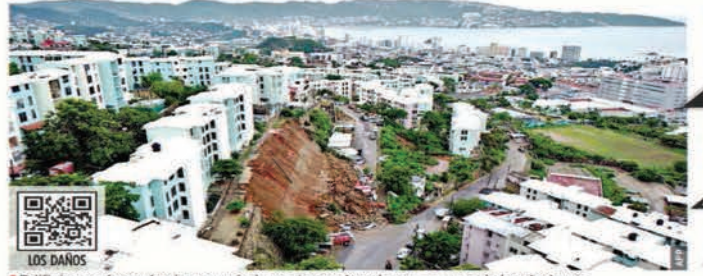
Edificios en Acapulco han quedado en riesgo de colapso, a causa de los deslizamientos.

CHILPANCINGO.- Acapulco aún no se recupera del huracán "Otis" y, menos de un año después, el ciclón "John" volvió a devastar la ciudad.