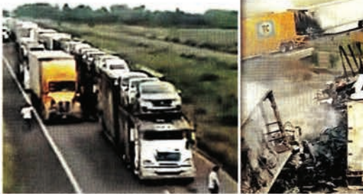
La Maxipista Culiacán-Mazatlán fue bloqueada durante la madrugada del sábado con tráileres que fueron incendiados por hombres armados.

Los bloqueos se reportaron después de que fueron abandonados seis cuerpos en el interior de una camioneta tipo Van al sur de Culiacán, con un mensaje en uno de los costados en el que se leía: