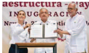
• GIRA. AMLO y Sheinbaum, en Nayarit.

"Es una responsabilidad mayor cuando sabes que eres parte de esta transformación que tiene que continuar, y eso requiere una entrega total como persona, porque en efecto tu vida le pertenece a tu pueblo y a tu patria", destacó.