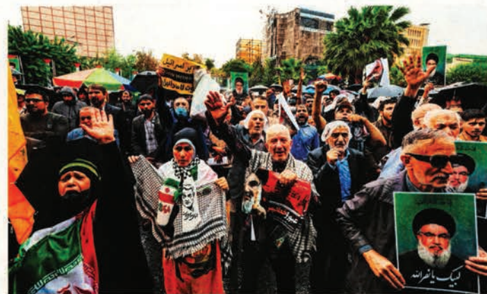
Manifestantes se reúnen bajo la lluvia durante una protesta en Teherán, capital iraní, por el asesinato de Hassan Nasralá.

La organización islamista promete vengar el asesinato de Hassan Nasralá, quien murió en un bombardeo. EU satisfecho con la acción; Irán dice que los israelíes firmaron su destrucción