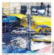
"Diablitos" en el mercado Sonora, de la CDMX

La CDMX incumplió la promesa de combatir el robo de energía eléctrica en mercados públicos. Después de los incendios en La Merced y San Cosme en diciembre de 2019 -ambos atribuidos a cortocircuitos en "diablitos"-, el Gobierno central advirtió en 2020 que se reforzarían los operativos para detectar, retirar y sancionar la colocación de conexiones ilegales. También se informó que desde dicho año y hasta 2022 se destinarían unos 700 millones de pesos para abatir este delito, cometido en al menos 10