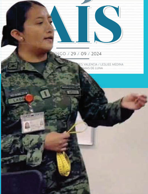
SÍMBOLO | Entre las imágenes que conforman el video destaca el momento en que dos mujeres militares le miden la banda presidencial.