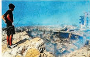
Un hombre observa los edificios destruidos en Choueifat, al sureste de Beirut, donde murió Nasralá.

Para las autoridades israelíes, la muerte de Nasralá constituye una gran victoria frente a su archirival Irán y sus aliados en la región. El primer ministro Benjamin Netanyahu afirmó que marca un “punto de inflexión histórico” en la lucha de su país contra sus “enemigos”. “Saldamos nuestras cuentas con el responsable del asesinato de innumerables israelíes y muchos ciudadanos de otros países, incluidos clientes de estadounidenses y decenas de franceses”, afirmó Netanyahu, quien advirtió que seguirá “golpeando” a sus contrincantes porque “el trabajo aún no está completo”. En un mensaje en video, advirtió que “en los próximos días enfrentaremos desafíos importantes y los enfrentaremos juntos”. El premier israelí reveló también que autorizó el bombardeo a la vis-