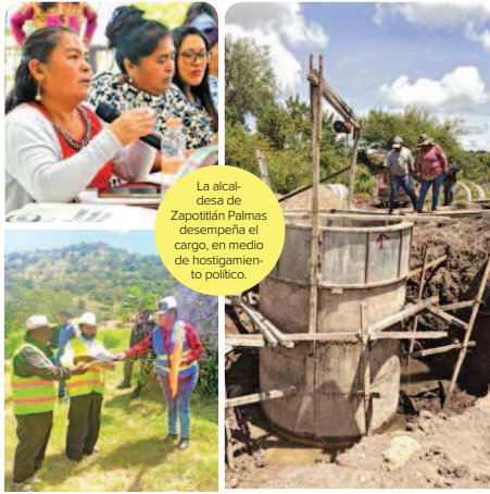
La alcaldesa de Zapotitlán Palmas desempeña el cargo, en medio de hostigamiento político.

ALERTA POR APERTURA DE PRESA. La Comisión Nacional del Agua lanzó una alerta para nueve municipios veracruzanos en la cuenca del Papaloapan por la apertura, mañana, de las compuertas de la presa Cerro de Oro, que se ubica en el municipio de San Lucas Ojitlán, Oaxaca. Arrojará 500 metros cúbicos de agua por segundo, afirmaron. — Lourdes Lopez