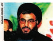
Hassan Nasralá era líder de Hezbolá desde 1992.

Bajo el mando de Nasralá, siempre vestido con túnicas clericales y un turbante negro, Hezbolá logró tener influencia más allá de Líbano.