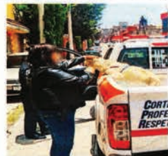
La Propaem explicó que tras asegurar a los animales, los canalizan con asociaciones protectoras en las que los rehabilitan e inician un procedimiento administrativo común en contra de la persona que haya incurrido en alguna falta contra los principios de bienestar animal.

Explicó que hay quienes maltratan animales porque aprendieron que así deben de ser tratados, con un sentido de inferioridad; otros lo hacen por una manifestación de poder para descargar ira, enojo o impotencia; y el que llega a la sociopatía al