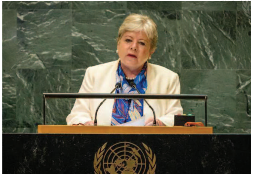
Alicia Bárcena, condenó enérgicamente el asalto a la embajada mexicana en Quito, Ecuador.

decimiento por la condena generalizada de este acto como comunidad internacional. No podemos olvidarlo ni normalizarlo”, agregó Bárcena.