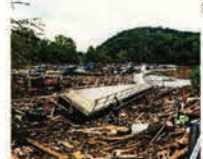
Chimney Rock, en Carolina del Norte, quedó devastado por Helene.

El presidente Joe Biden dijo que la devastación causada por Helene ha sido “abrumadora” y prometió que enviará ayuda. ● AP