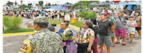
Cientos de personas hicieron fila para recibir ayuda, tras el paso del huracán "John", en Acapulco.

Decenas de colonias y fraccionamientos de Acapulco quedaron bajo el agua. Zona Diamante, una de las más afectadas por "John", se levantó en la década de los 90 con complejos habitacionales, pese a que es un lugar de humedales.