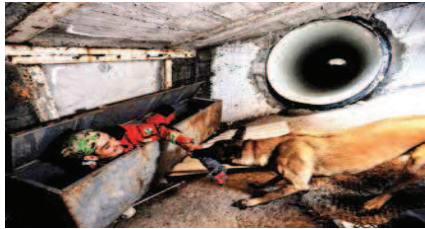
Cada sábado, Ombrá es entrenada en el simulador ubicado en Ciudad Universitaria, que tiene 50 metros de túneles.