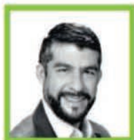
MAURICIO TABE MIGUEL HIDALGO