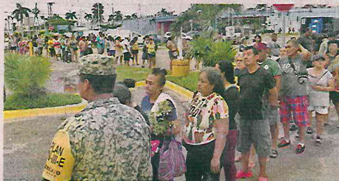
Cientos de personas hicieron fila para recibir ayuda, tras el paso del huracán "John", en Acapulco.

Desde el huracán "Paulina", en 1997, luego con la tormenta "Manuel" y el huracán "Ingrid", en 2013, los habitantes de esta zona han sufrido los estragos del agua.