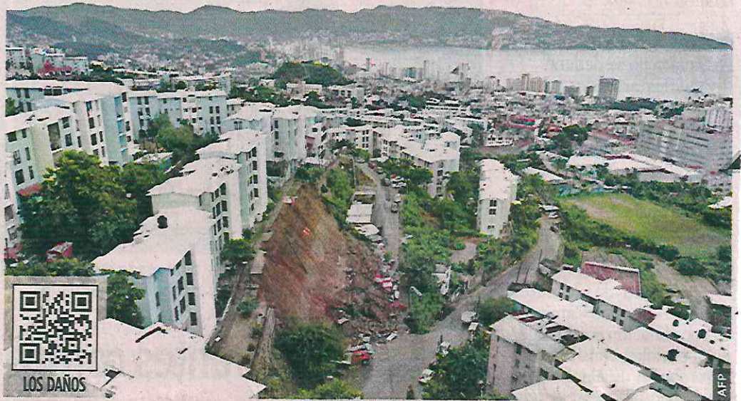
Edificios en Acapulco han quedado en riesgo de colapso, a causa de los deslaves.

Zona Diamante, una de las más afectadas por "John", se levantó en la década de los 90 con complejos habitacionales, pese a que es un lugar de humedales.