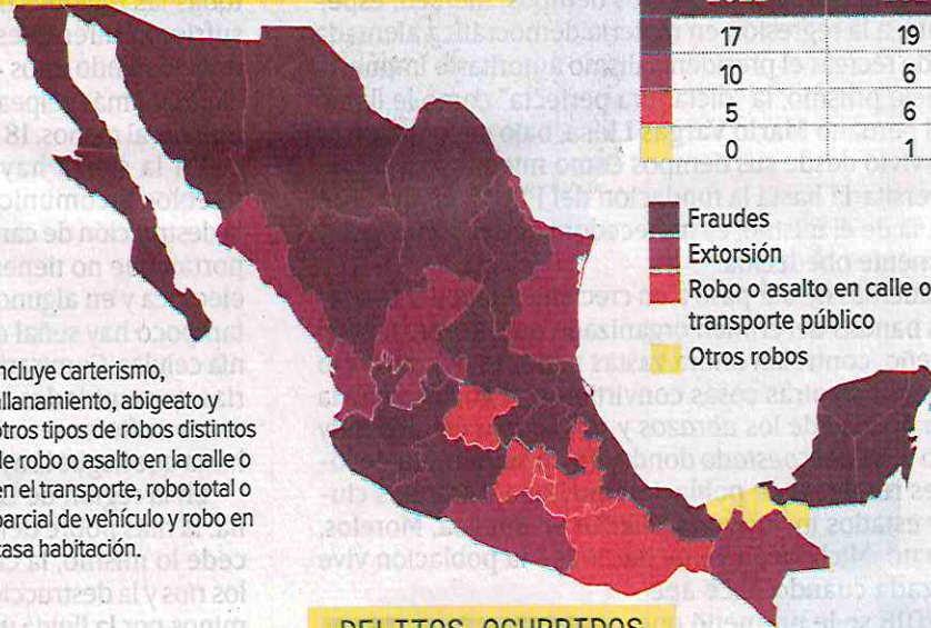
Número de entidades federativas