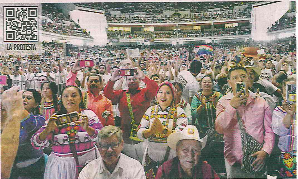
Integrantes de comunidades indígenas participaron en un acto multitudinario para la entrega protocolaria de diversas obras de infraestructura en Tepic.

las abstenciones, los trabajadores doblaron sus pancartas se dieron la vuelta y salieron por el acceso que estaba a sus espaldas.