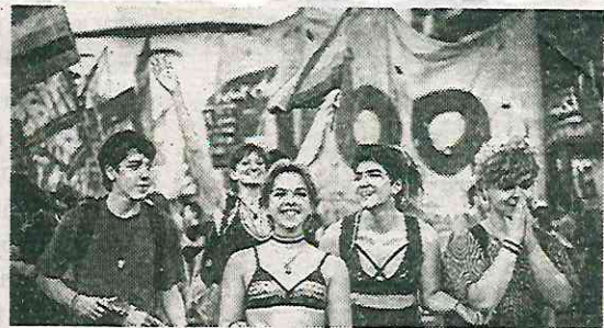
Son más los miembros menores de edad

De acuerdo con la Encuesta Nacional sobre la Diversidad Sexual y de Género (ENSIEG), en 2021, el 5.1% de la población en México, es decir, poco más de 5 millones de habitantes, se declararon con una orientación sexual o identidad de género LGBTI+, siendo los jóvenes entre 18 y 29 años la mayoría de esta comunidad, con el 46.5% de sus integrantes, seguida por los menores de entre 15 y 17 años, con cerca de un millón de personas que se identificaron con este sector.