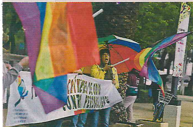
Los manifestantes urgieron a las autoridades a recopilar información de crímenes de odio, con perspectiva de género.