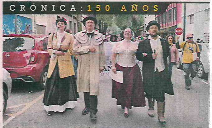
Personajes históricos de la Guerrero encabezaron ayer la comitiva que recorrió la zona.

de los fundadores del grupo de rescate Topos, el cual comenzó a operar tras el sismo de 1985, es también oriundo de la comunidad.