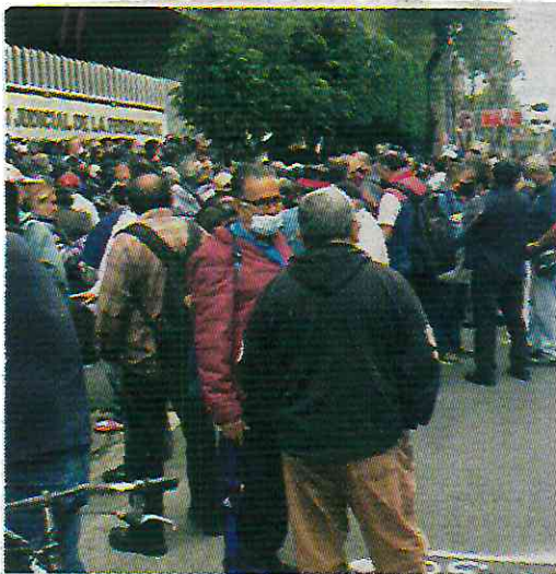
No están conformes trabajadores de Ruta 100