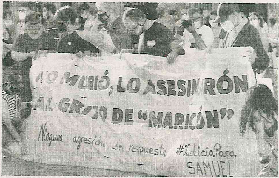
· Aumentán las agrsesiones a la comunidad LGBTQ+

En esta alcaldía, los actos de discriminación han aumentado en los últimos años debido