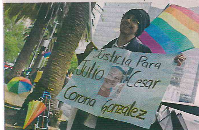
De acuerdo con un observatorio, en la Ciudad de México se han registrado 11 desapariciones de esta población.