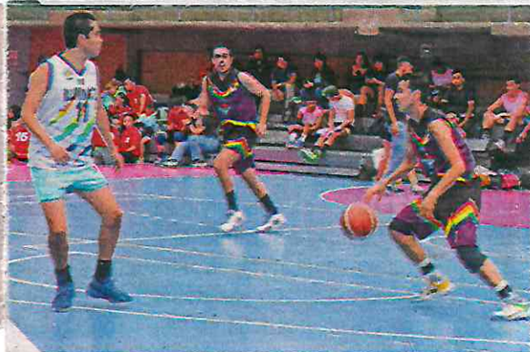
Con el respaldo de familiares y amigos los atletas comenzaron a competir.