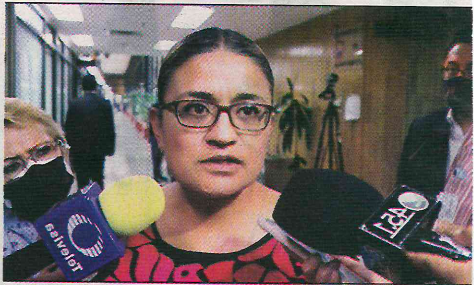
Se gastó el dinero en hacerse publicidad

Del mismo modo, el organismo electoral informó que