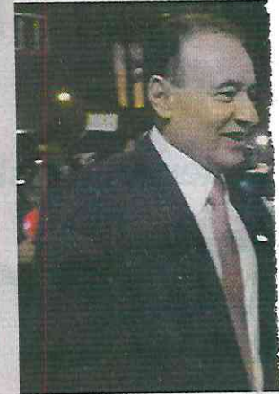
■ Alfonso Durazo, Gobernador de Sonora.