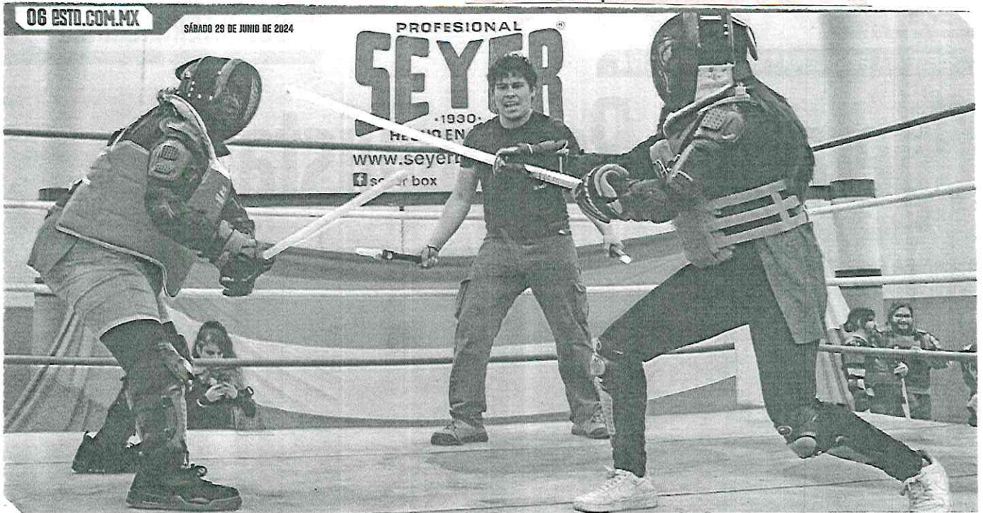
Los combates con sable de luz llamaron mucho la atención en el primer día de competencias del evento.