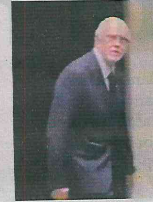
■ Miguel Ángel Navarro, Gobernador de Nayarit.