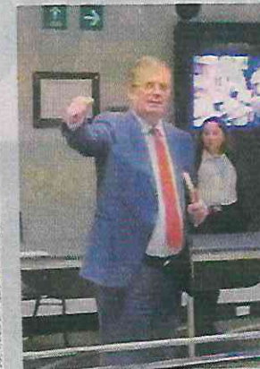
■ Marcelo Ebrard, futuro titular de Economía.