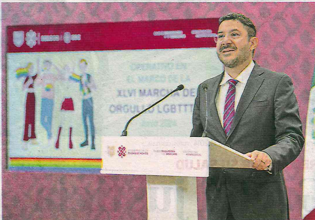
La marcha LGBTQ+, una expresión y conquista de las libertades, declaró el jefe de Gobierno, Martí Batres