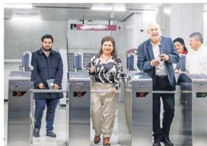
Este viernes, la jefa de Gobierno recorrió el tramo Cuauhtémoc-Chapultepec en un convoy.

Cabe recordar que en julio de 2022 fue suspendido el tramo de Pantitlán a Salto del Agua y reabrió el 29 de octubre de 2023, un año tres