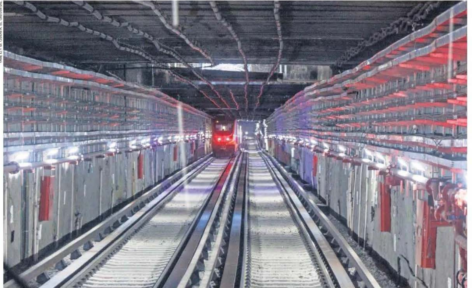
Actualmente se llevan a cabo pruebas referentes al software, que permite el pilotaje automático del CBTC de la Línea Rosa, explicó la jefa de Gobierno, Clara Brugada.

Está concluido al 100% de Cuauhtémoc a Chapultepec; en estos días se efectuarán las últimas pruebas y certificación, pues "no vamos a arriesgar la seguridad", señala la jefa de Gobierno