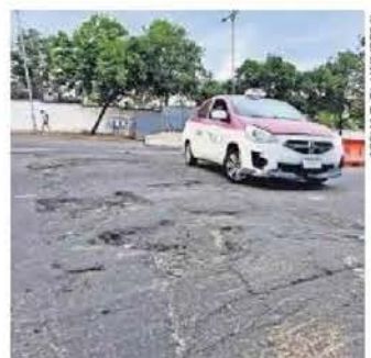
El problema de los baches en la Ciudad afecta a miles de personas, consideró Info-CDMX.

Propuso al pleno del Info-CDMX ordenar a la alcaldía realizar una búsqueda exhaustiva de la información en un plazo de 10 días hábiles. ●