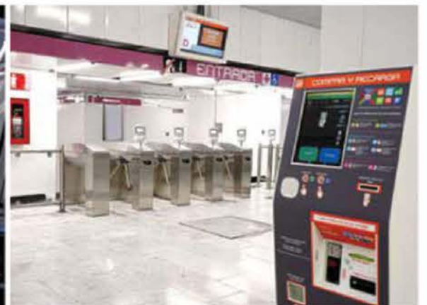
La infraestructura del tramo Cuauhtémoc-Chapultepec, de 4 kilómetros, está terminada al 100%, indicó el director del Metro.