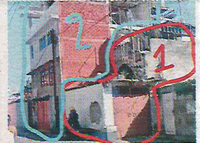
Vecinos denuncian esta invasión