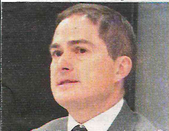
El edil ha sido omiso a la situación

Entre el 1 de octubre y el 13 de diciembre, se recibieron 769 denuncias por bacheo en la demarcación, de las cuales 280 no han sido atendidas