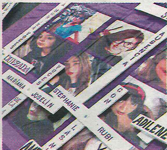
· Ser mujer puede costar la vida

De manera continua, en los lugares 35, 36 y 37 aparecen las alcaldías Álvaro Obregón (0.99 casos por cada 100 mil mujeres); Benito Juárez (1.69) y Milpa Alta (4.98), todas estas alcaldías suman 4 feminicidios de enero a noviembre de este 2024. Posteriormente, en los lugares 52, 53, 54, 55 y 56 aparecen Coyoacán (0.94), Gustavo A. Madero (0.50), Tláhuac (1.48), Tlalpan (0.81) y Xochimilco (1.33) con tres feminicidios en 11 meses. Mientras que las alcaldías Miguel Hidalgo (0.90) y Venustiano Carranza (0.86) aparecen en los lugares 87 y 88 con dos feminicidios. La primera, la gobierna el PAN y la segunda, Morena y sus aliados políticos.