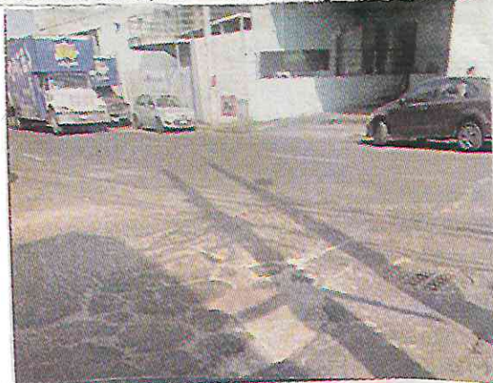
Las calles de la demarcación presentan hoyos