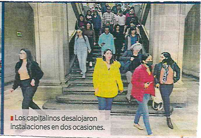
■ Los capitalinos desalojaron instalaciones en dos ocasiones.