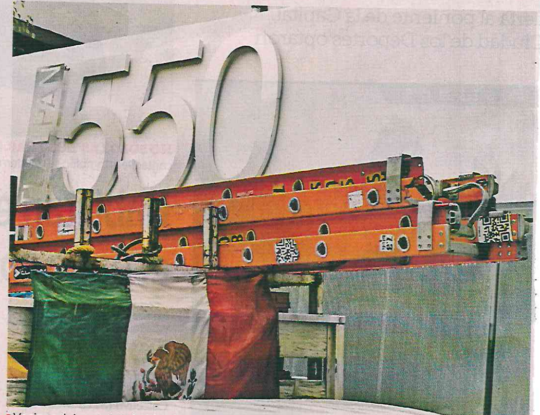
■ Vecinos del complejo habitacional, ubicado en la Colonia Moderna, en la Benito Juárez, señalaron que algunos departamentos fueron reducidos y que el piso se está desnivelado.

“Las losas están sumamente desniveladas, tanto de los departamentos como de áreas comunes. Yo pregunté eso al arquitecto, le digo ‘usted me habla de los 130 pilotes que metieron para reforzar en las torres, intervi-