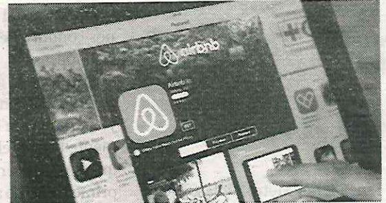
Ponen freno a las altas tarifas

Indicó que el problema no es la llegada de nómadas digitales, sino la falta de planeación y la irresponsabilidad de firmar un convenio que priorizó el desarrollo económico focalizado en algunos sectores de la capital.