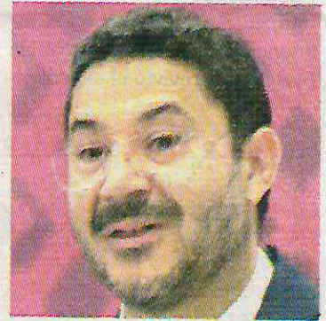
En memoria de los estudiantes

Ante vecinos de la nueva colonia "Estudiantes de 1968", el mandatario local aseveró que el expresidente Gustavo Díaz Ordaz, "traicionó a la Revolución Mexicana. Sacrificó en Tlatelol-