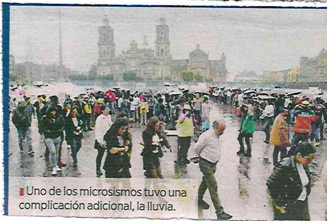
■ Uno de los microsismos tuvo una complicación adicional, la lluvia.