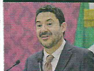
Martí Batres, Jefe de Gobierno

El día de hoy anunciamos el cambio de nombre de la colonia denominada hasta ahora Colonia Nueva Díaz Ordaz, por el nombre Colonia Estudiantes de 1968”.