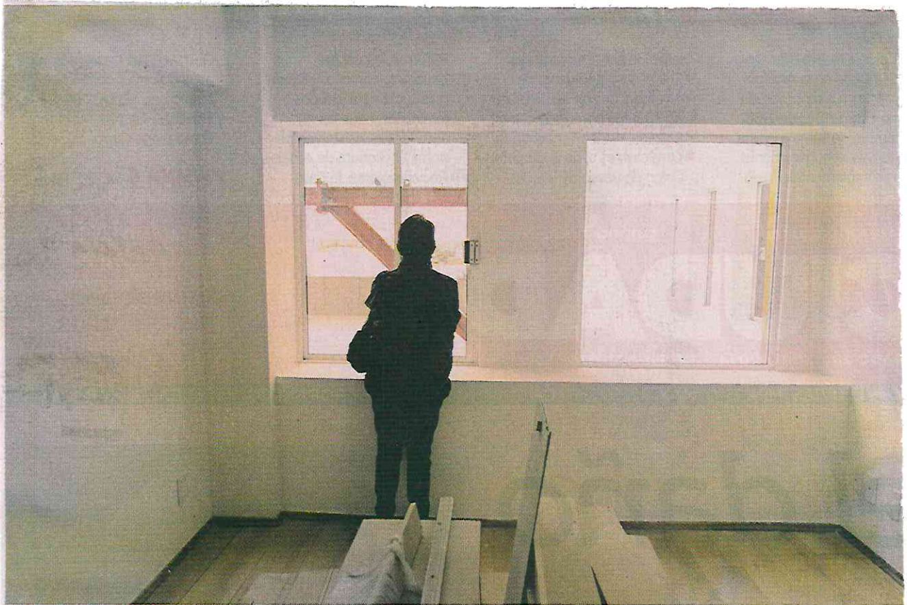
INCERTIDUMBRE. Habitantes de Tlalpan 550 criticaron la falta de información sobre los dictámenes de construcción.