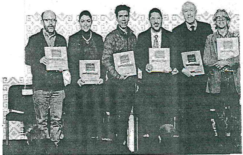
• HISTORIA. El jefe de Gobierno presentó también el libro El Zócalo , en el Museo de la Ciudad de México.

taron una encuesta donde 90 por ciento de los habitantes aprobaron el cambio de nombre y ante las propias recomendaciones ciudadanas se eligió Estudiantes de 1968 sobre Lucha Social de 1968.