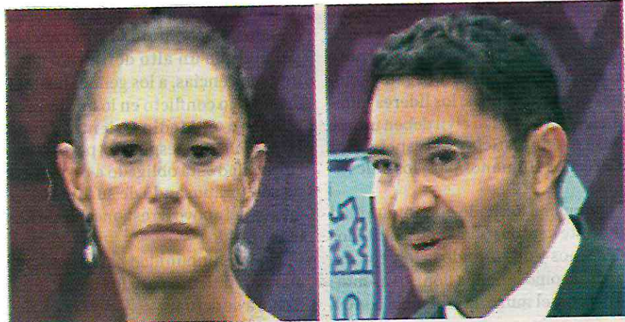
"Ciudad innovadora y de derechos" con Batres y Sheinbaum