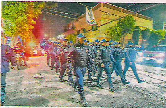
En el operativo estuvieron al menos 100 elementos de la SSC CdMx y personal del Invea