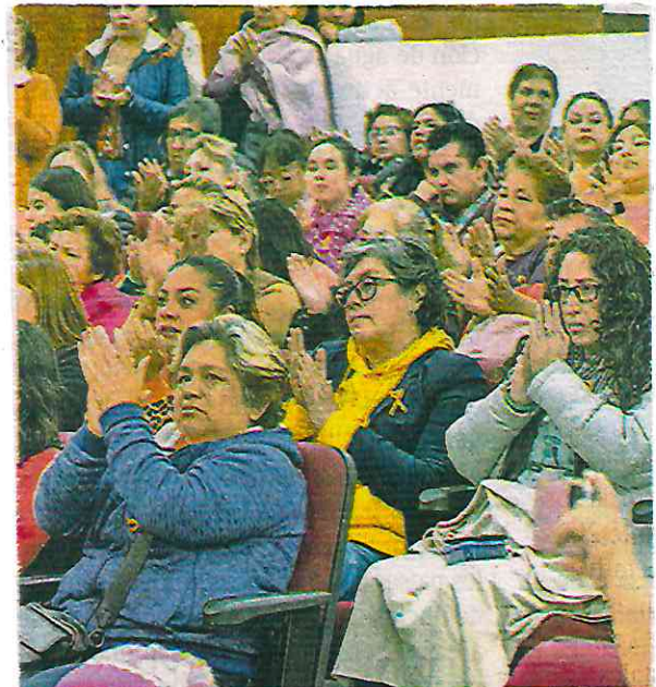
Mujeres de la demarcación en el Auditorio Silvestre Revueltas