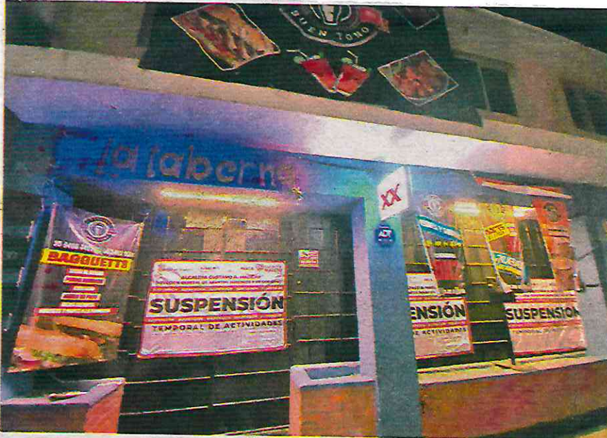
Algunos operaban como local de venta de alimentos, pero sin permiso de bebidas alcohólicas