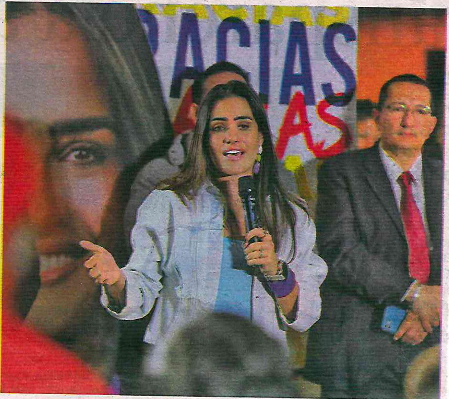
Alessandra Rojo de la Vega, virtual alcaldesa electa de la Cuauhtémoc

Los magistrados electorales determinaron que el PAN y Rojo de la Vega, virtual alcaldesa electa de la Cuauhtémoc, no reunieron los requisitos aplicables que exige el recurso de reconsideración para admitir a estudio la demanda, porque la