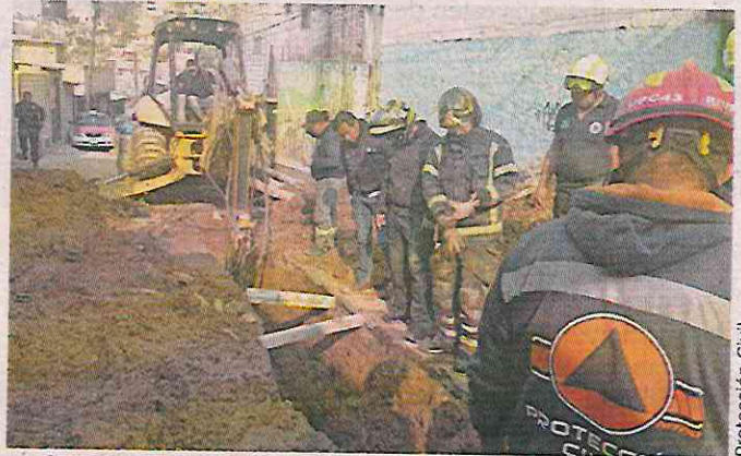
Los jóvenes, de 24 y 35 años, quedaron sepultados a 3 metros de profundidad en una zona de obras.

El Gobierno capitalino informó que las víctimas eran dos jóvenes, de 25 y 34 años, quienes hacían labores de excavación para instalar drenaje en las colonias.