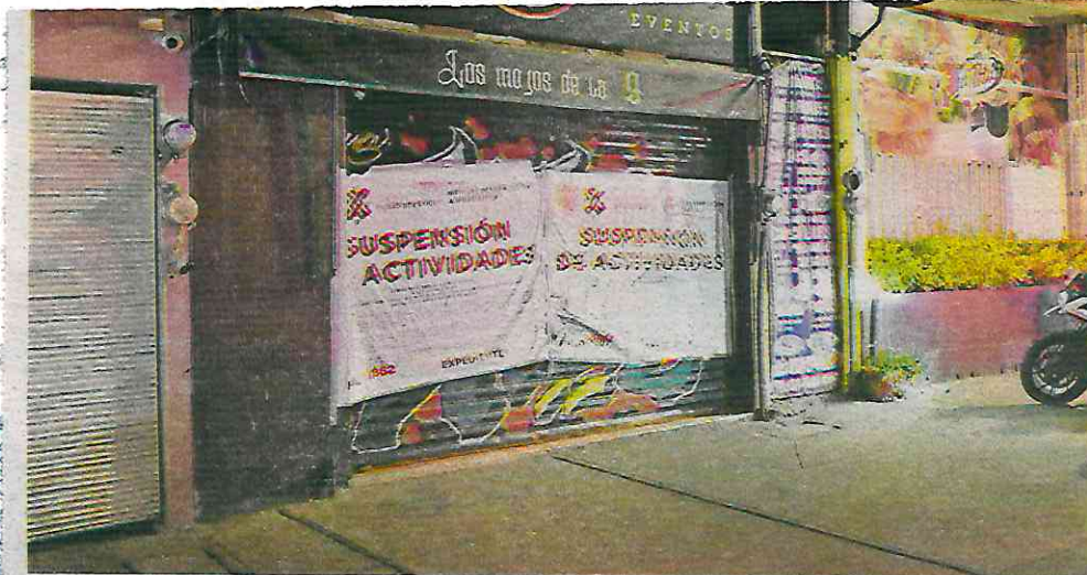
Las acciones responden a denuncias ciudadanas relacionadas a disturbios, venta de alcohol en vía pública y exceso de ruido