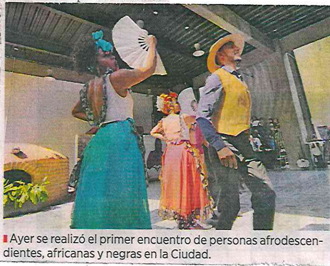
■ Ayer se realizó el primer encuentro de personas afrodescendientes, africanas y negras en la Ciudad.

“Aún hay muchas deudas que el Estado, como tal, tiene con las poblaciones afrodescendientes; por ejemplo, los problemas de perfilamiento racial, en donde agentes de Gobierno desarrollan violencia directa”.