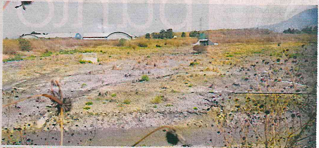
SIN UNA GOTTA. Lo que era un humedal ahora es un terreno árido.

Al Parque Cuitláhuac, alguna vez proyectado como el Chapultepec de Iztapalapa, lo aseñan ahora los incendios.