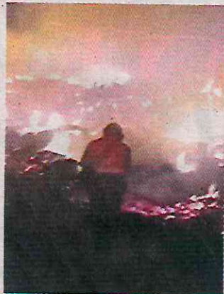
El incendio del viernes consumió una hectárea de pasto.

“El suelo sigue caliente, debajo sale todavía humo, quitamos el pasto seco y