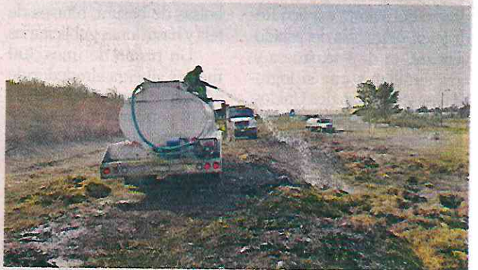
Ayer se mantenían las maniobras de enfriamiento por parte de trabajadores de la Sobse para evitar otra conflagración.