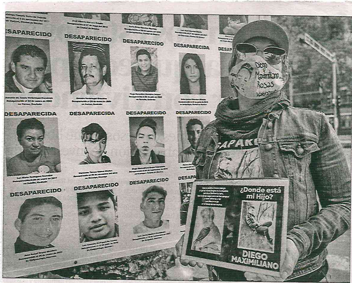
▲ Familiares que buscan a sus seres queridos establecieron el sitio de memoria en una jardinera de Paseo de la Reforma y Río Rhin.