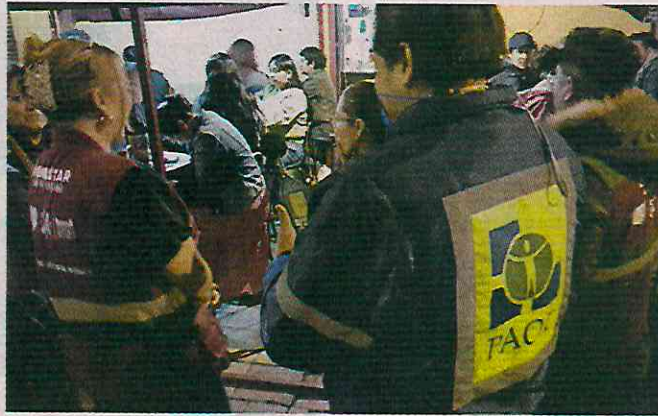
■ En los bares del Andador Regina, el ruido de los bares supera los 80 decibeles en el horario en el que el límite aceptable es 65.

“El ruido causa una afectación severa a la salud, estos establecimientos están cercanos a departamentos, en don-