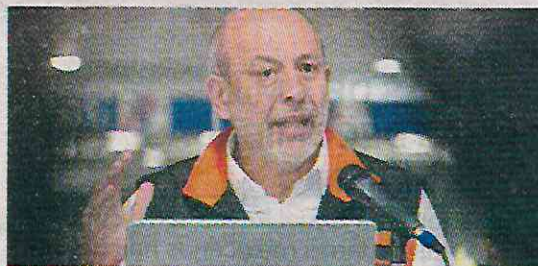
Tras los constantes problemas en el transporte

Además señaló que se registró humo en la estación Hidalgo y pese a ello, nunca se detuvo el servicio poniendo en riesgo la vida de los usuarios. De acuerdo al panista, este tipo