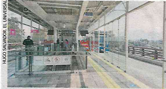
HUGO SALVADOR, EL UNIVERSAL