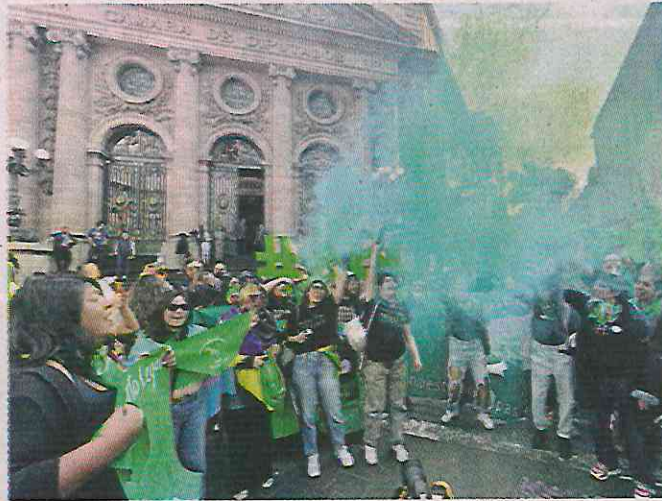
En noviembre, activistas se manifestaron frente al Congreso local, en exigencia de la despenalización total del aborto.