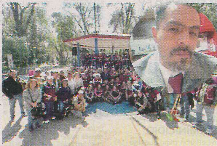
Los hechos fueron el pasado 8 de enero

Según relatan en un documento en poder de Diario Basta, dirigido a la Comisión de Derechos Humanos de la Ciu-