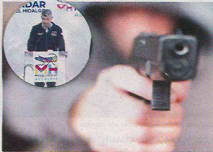
El edil no dio las cifras reales de la alcaldía que gobierna

Acompañado de la comisionada en seguridad ciudadana,