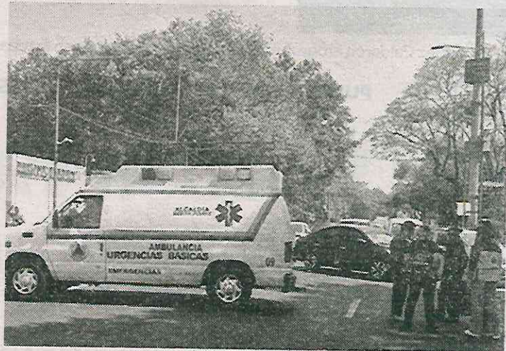
• Demostraron su descontento con la situación

• El concejal hizo un llamado a las autoridades de BJ a atender las necesidades de los trabajadores y garantizar que no se vulneren sus derechos ni se ponga en riesgo su estabilidad laboral