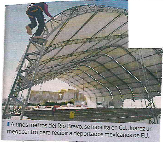
■ A unos metros del Río Bravo, se habilita en Cd. Juárez un megacentro para recibir a deportados mexicanos de EU.

En distintos puntos fronterizos, el Gobierno tendrá disponibles 189 autobuses para trasladar a los mexicanos hasta los Centros de Atención donde estarán desplegados 125 servidores públicos para recibir a los connacionales y ofrecerles servicios de reintegración, atención médica, alimentación y estancia.