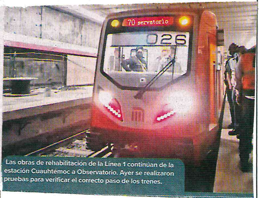
Las obras de rehabilitación de la Línea 1 continúan de la estación Cuauhtémoc a Observatorio. Ayer se realizaron pruebas para verificar el correcto paso de los trenes.