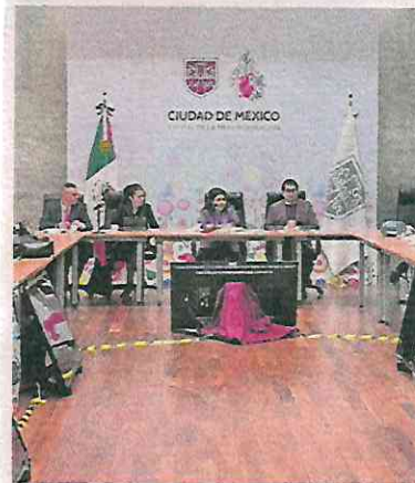
La jefa de Gobierno se reunió con familiares de desaparecidos.

Al respecto, la fiscal Bertha Alcalde Luján explicó que se está trabajando en conjunto con otras dependencias para fortalecer las acciones, no sólo de búsqueda de desaparecidos, sino también de las investigaciones por desaparición, que incluye también la judicialización de casos y la obtención de sentencias condenatorias. ●