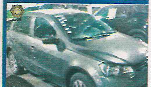
Un hombre que posiblemente asaltó una tienda de conveniencia y que pertenece a la Secretaría de Seguridad Ciudadana fue detenido

del establecimiento comercial e informó a los efectivos que un sujeto lo amagó con un objeto parecido a una pistola y lo despojó del dinero en efectivo producto de la venta del día, para posteriormente darse a la fuga a bordo de un vehículo de color