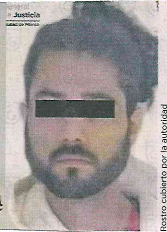
Rostro cubierto por la autoridad