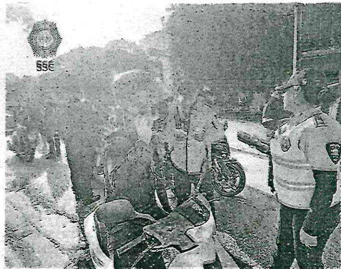
El operativo Salvando Vidas busca concientizar a las personas motociclistas sobre la necesidad de disminuir los riesgos al conducir