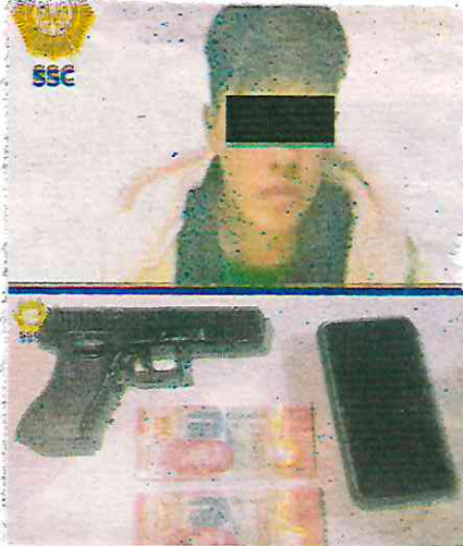
Intentó darse a la fuga