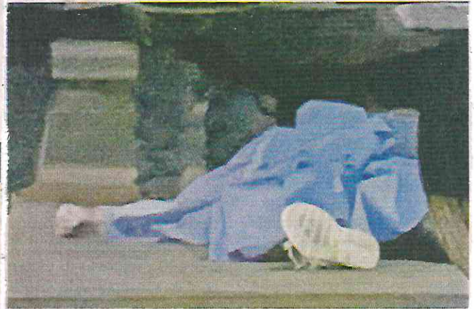
Con sus maletas a un lado, el cuerpo de la víctima quedó junto al vehículo de alquiler que abordó en el Aeropuerto.

Por ser el único testigo hasta el momento, el taxista fue presentado ante un agente del Ministerio Público.