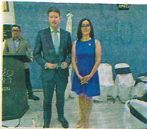
El secretario Pablo Vázquez se reunió con empresarios de Iztapalapa

Los integrantes de la Asociación de Empresarios de Iztapalapa agradecieron la disposición del secretario de Seguridad Ciudadana, Pablo Vázquez Camacho y la apertura mostrada para trabajar de manera conjunta para consolidar a la Ciudad de México como la más segura de todo el país.