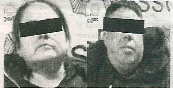
Ambos operaban para El Irving

Posteriormente, se les realizó una inspección en la cual se les hallaron 140 dosis de cocaína, 29 de marihuana, una bolsa con cristal, dos teléfonos celu-