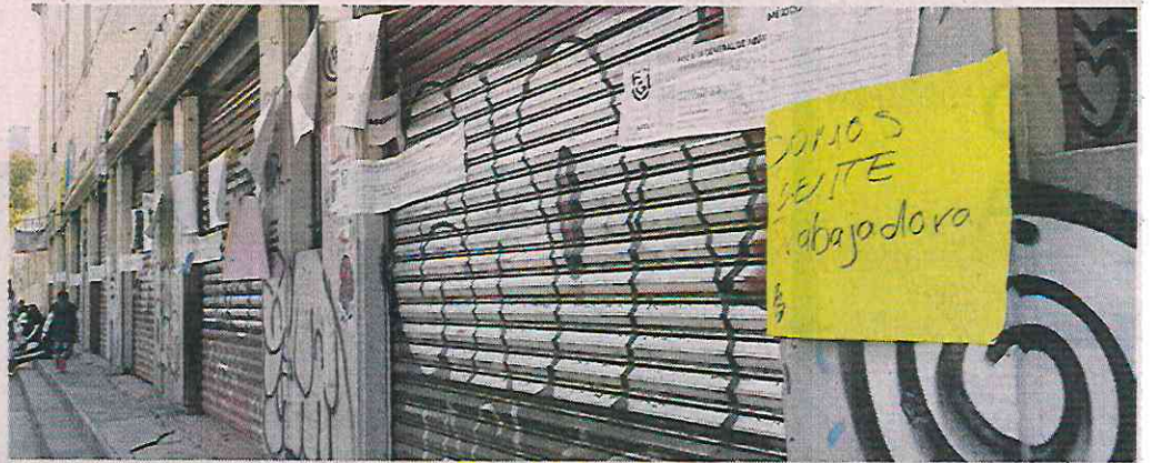
■ La Plaza Pensador Mexicano fue asegurada la semana pasada por una investigación de narcomenudeo.

Blanquita, la plaza era ocupada por menos de 10 comerciantes en la planta baja, de acuerdo con vendedores en la zona.