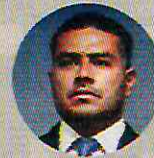
● Omar García Harfuch

y votaran por unanimidad, con el sí de la oposición, reformar lo necesario para que Omar opere la Secretaría que imaginó y diseñó: su policía hará investigación procesal, conducirá el Sistema Nacional de Inteligencia en materia de seguridad pública, coordinará estrategias y desempeños en el gobierno federal y con los estatales y municipales, y auditará el dinero y recursos que lleguen a los estados y municipios. Es un triunfo