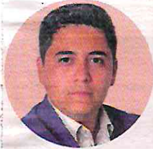
POR RAFAEL SOLANO