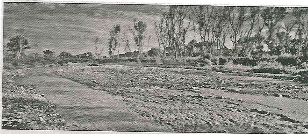
▲ El 6 de agosto de hace 10 años, se derramaron 40 mil metros cúbicos de ácido sulfúrico en los ríos Sonora y Bacanuchi, que afectaron a 25 mil pobladores de ocho municipios, en lo que fue calificado de “el peor desastre ambiental de la historia de la minería en México”.