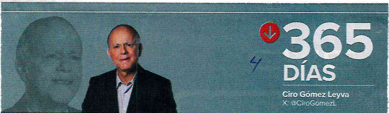
Ciro Gómez Leyva X: @CiroGomezL