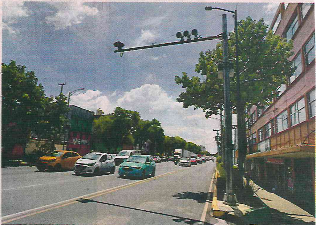
UN CASO ATÍPICO. El radar está instalado sobre Eje 3 Sur, al cruce con José María Bustillos. La cantidad de accidentes alrededor es motivo de estudio.

Hernández encontró que la primera era cierta, pues una infracción monetaria se asocia más a los gastos inherentes de tener un automóvil, mientras que el impacto es mayor cuando se destina tiempo para saldarla.