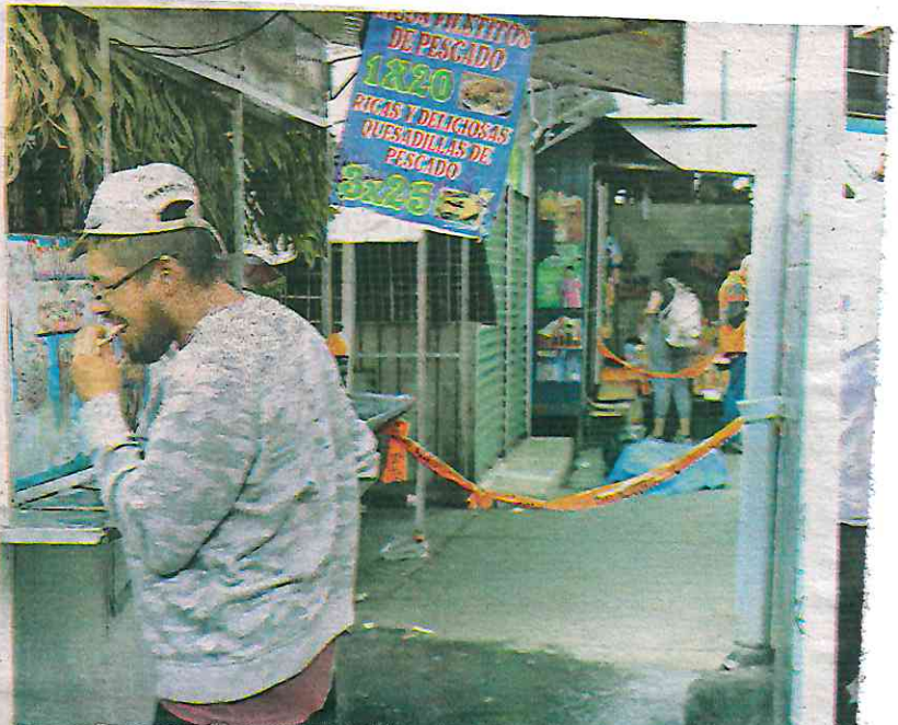
Extraña muerte de un hombre en el exterior de la estación del Metro Acatitla, hecho que fue ignorado por usuarios que vieron y pasaron por el lugar; en tanto otros desayunaban