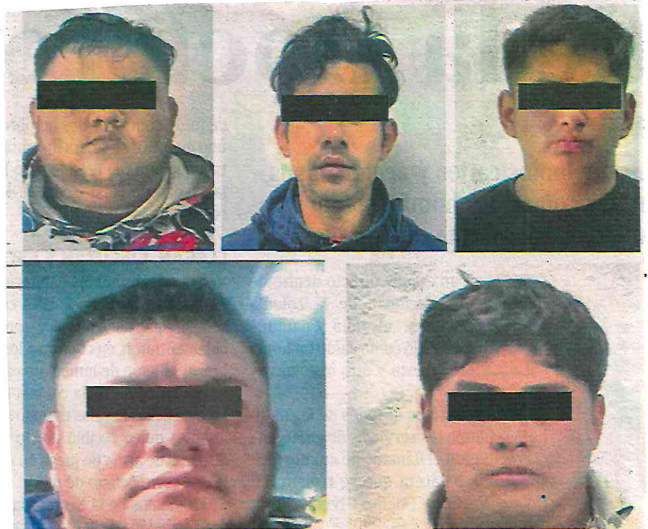
Tras trabajos de inteligencia se logró detener a presuntos secuestradores

Los policías se acercaron a la persona, corroboraron su identidad y cumplieron el mandato judicial, por lo que el hombre de 31 años de edad fue detenido, le informaron sus derechos de ley, para pos-