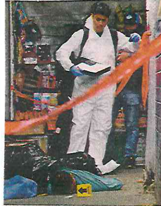
■ Pasadas las 12:15, peritos levantaron el cuerpo.

Cerca de las 9:30 horas, servicios de emergencia atendieron el reporte en la entrada al Metro, en la Calzada Ignacio Zaragoza, Colonia Santa Martha Acatitla, donde los paramédicos determinaron que había muerto.