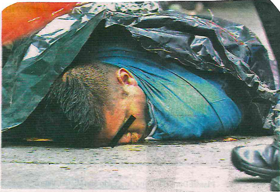
La zona fue acordonada y resguardada por lo policías capitalinos por alrededor de seis horas