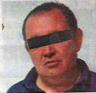
El conductor detenido tiene 53 años de edad.

La Secretaría de Seguridad Ciudadana indicó que una mujer de 32 años, quien se identificó como la madre del menor, narró que se encontraban vendiendo dulces cuando una camioneta de color gris perdió el