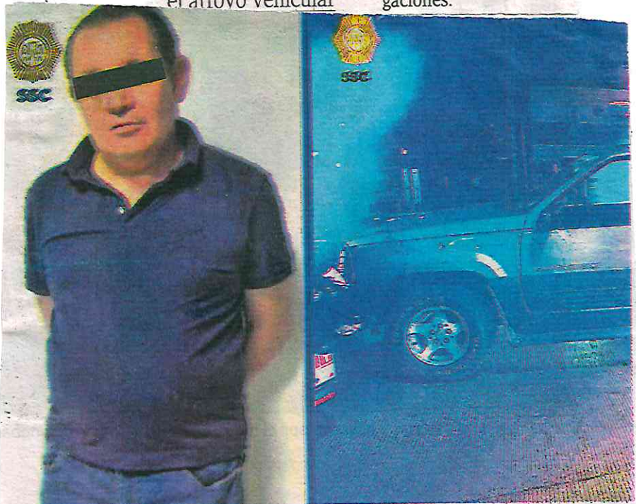
Oficiales de la SSC detuvieron al responsable de arrollar a dos menores de edad, donde uno murió y otro está grave

Un vehículo a toda velocidad embistió al pequeño y al otro vendedor, arrojándolos brutalmente contra el arroyo vehicular