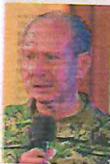
José Rafael Ojeda