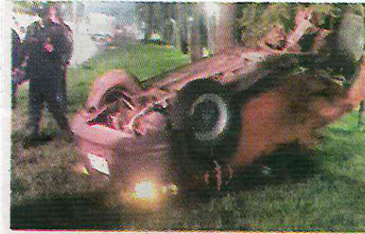
El llamante coche quedó hecho chatarra