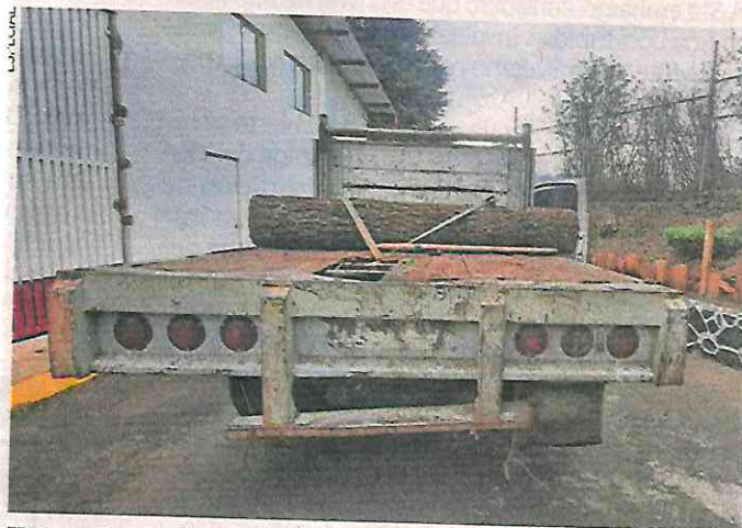
Una camioneta blanca y una motosierra también fueron aseguradas por los policías de la SSC.

Los policías detuvieron a los hombres de 22 años y uno que dijo tener 17 años, quienes junto con lo asegurado, los pusieron a disposición del agente del Ministerio Público, quien determinará su situación jurídica e integrará la carpeta de investigación del caso. ●