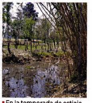
En la temporada de estiaje, el espacio es vulnerable a incendios.

En las zonas próximas a los lagos, abundan garzas, pelicanos, así como prados y árboles con musarañas, murciélagos y tlacuaches, que suelen buscar comida en los depósitos de basura.