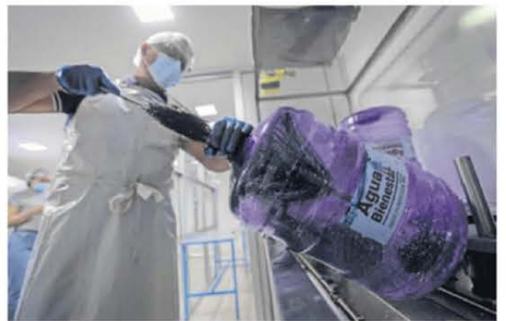
Los garrafones pasan por un meticuloso proceso de purificación que inicia con la extracción del líquido de los pozos; explicó el titular de la Segiagua.

"Para nosotros sí ha sido, ahora sí que, una ganga, gastamos mucho en agua, botellas y garrafones, porque, sobre todo, se usa para comer, para preparar los alimentos y para beber, entonces pues sí nos conviene", explica otro habitante que espera en la fila sentado en un banquito de plástico.