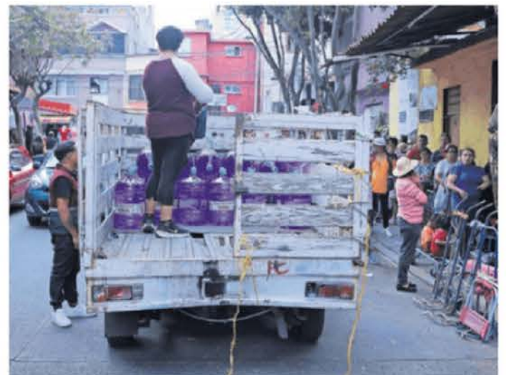
Tras largas horas de espera, los garrafones llegan de la planta de Xotepingo y empiezan a ser distribuidos a partir de las 17:00 horas.

En la calle se ve a gente de todas las edades a la espera de sus garrafones, algunos llegan con diablitos, huacales y lazos o incluso se ayudan con sillas de ruedas para cargar el garrafón lleno de vuelta a sus casas. Otros llevan sus banquitos, porque la espera, de unas siete horas, "es larga, pero vale la pena".