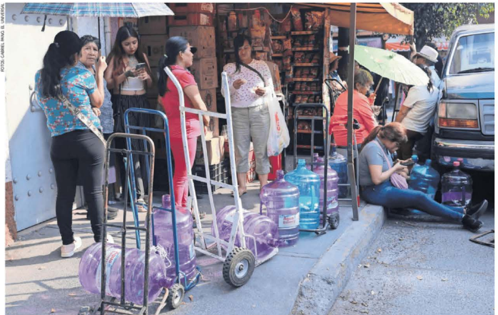
Acompañados de diablitos, bancos y sombrillas, vecinos del Pedregal de Santo Domingo, uno de los nueve barrios originarios de Coyoacán que enfrenta problemas de suministro, se forman cada miércoles para conseguir un botellón de 20 litros del programa Agua Bienestar.