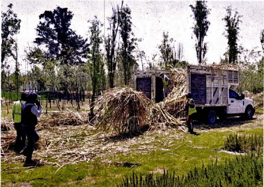
PREVENCIÓN. Cuadrillas de trabajadores se han dado a la tarea de remover vegetación seca para evitar que ocurran incendios.

La cercanía de la estación de bomberos de Coyoacán, en Avenida Canal Nacional,