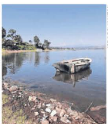
Las presas del Sistema Cutzamala no han recuperado niveles de 2019.

Acorde con la Secretaría de Medio Ambiente y Desarrollo Sostenible mexicana, la sobreexplotación de los recursos hídricos y los efectos del cambio climático han sido algunos de los desafíos que ha tenido que enfrentar el Sistema Cutzamala. ●