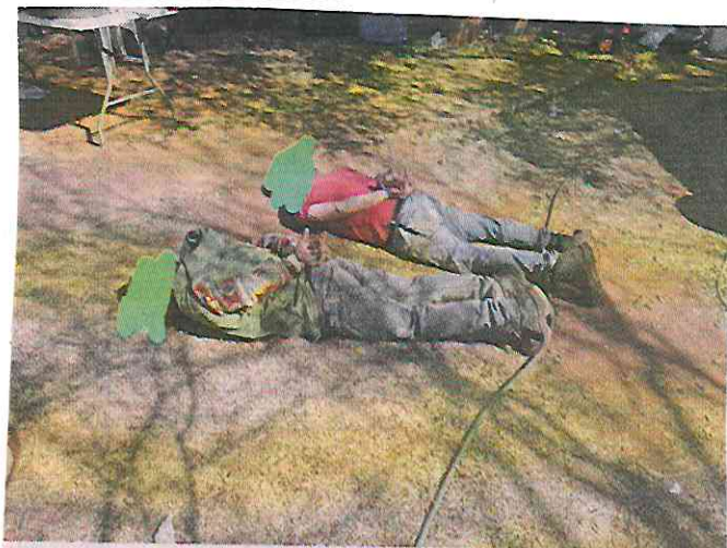
En el laboratorio fueron detenidos dos ciudadanos mexicanos y se reportó el decomiso de productos químicos.

Para la agencia, el Cártel de Sinaloa y el CJNG tomaron en 2019 el control de la producción del fentanilo ilícito que llega a Estados Unidos, luego de que China apretara sus controles ese año evitando que compañías de químicos en ese País enviaran a granel precursores del fentanilo a territorio estadounidense.