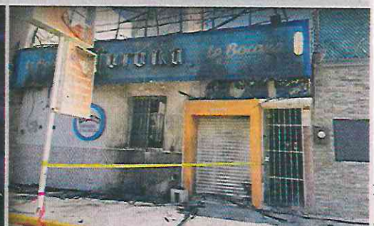
La semana pasada, extorsionadores incendiaron los restaurantes "Langostinos" y "La Bocana" porque el dueño de ambos sitios no pagó las cuotas al crimen organizado en Coatzacoalcos.