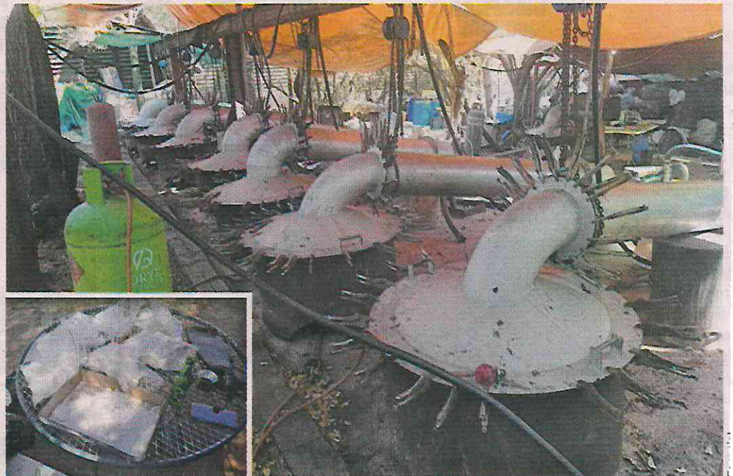
La Policía de Sudáfrica localizó un narcolaboratorio en una granja en el norte de ese país donde se fabricaba metanfetamina a escala industrial.

“Cuatro sospechosos, incluido el propietario de la granja y dos ciudadanos mexicanos, fueron arrestados el 19 de julio en una operación impulsada por inte-