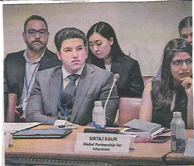
El Gobernador emecista de Nuevo León, Samuel García, en el foro "Inversión en el Futuro: Alimentación Escolar para el Desarrollo Sostenible" de la ONU.