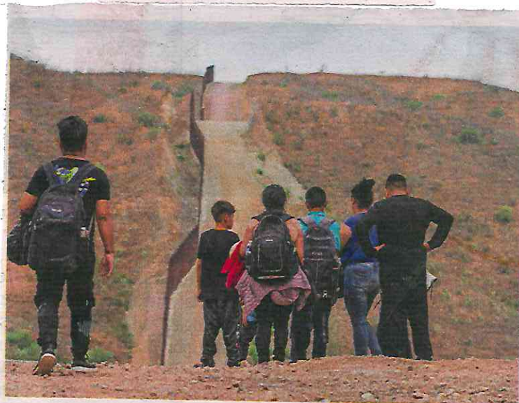
Migrantes frente al muro fronterizo en Arizona

“Hay comunidades en la periferia de Ciudad Juárez donde hay mucho reclutamiento de jóvenes a quienes los obligan a cruzar drogas, hay pueblos enteros totalmente controlados por el crimen organizado y los jóvenes no tienen otra opción”, concluyó.