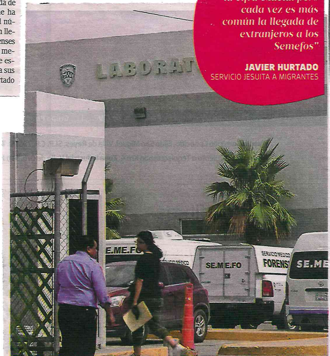
El Semefo de Ciudad Juárez resguarda cuerpos de migrantes por meses

JAVIER HURTADO SERVICIO JESUITA A MIGRANTES