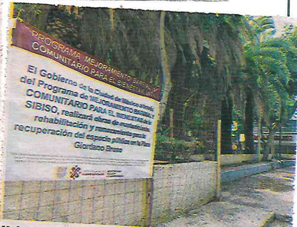
Habrà en la Giordano Bruno una inversión pública con participación social de 1.4 mdp

cas, construido centros comunitarios, bibliotecas, parques infantiles, parques skate para patinetas, bicicletas”.