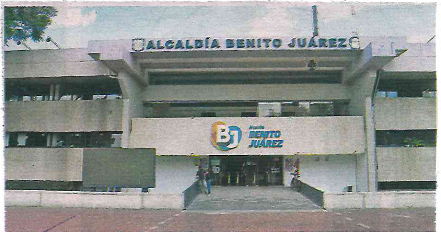
En el caso de alcaldías en las que hubo reelección, no se deberá instalar la comisión, sin embargo, se elaborará un acta administrativa circunstanciada

Con la medida también se podrán conocer los programas, proyectos, presupuestos, inmuebles, ingresos y egresos de centros generadores de aplicación automática, inventarios y almacenes, plantilla de personal, obras públicas y adquisiciones, asuntos en trámite y jurisdiccionales, auditorías y demás asuntos relevantes tramitados durante la gestión saliente.