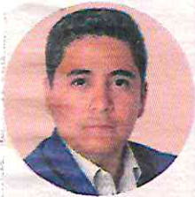
POR RAFAEL SOLANO