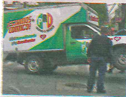
La unidad donde iba la concejal se estrelló contra otro vehículo

El presunto ataque ocurrió la mañana de este viernes en la colonia Petrolera