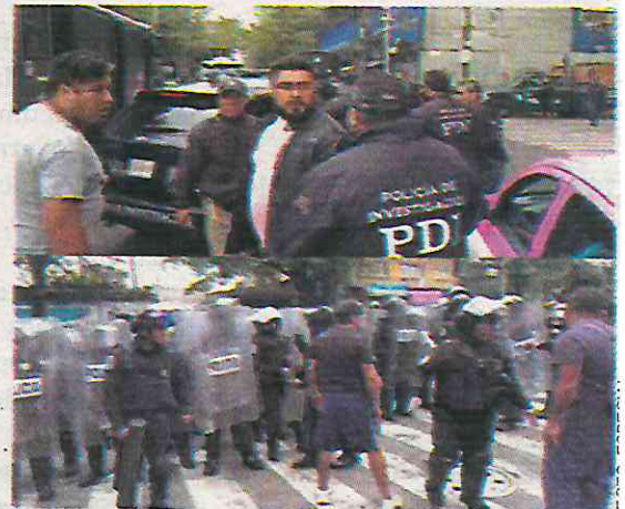
Se armó la rebambaramba

Cabe resaltar que, durante el zafarrancho al menos tres personas fueron detenidas y dos mujeres fueron aseguradas por agredir a los policías, mientras un fiscal tuvo que ser retirado de la zona en un vehículo de la SSC, tras ser atacado con piedras y palos.