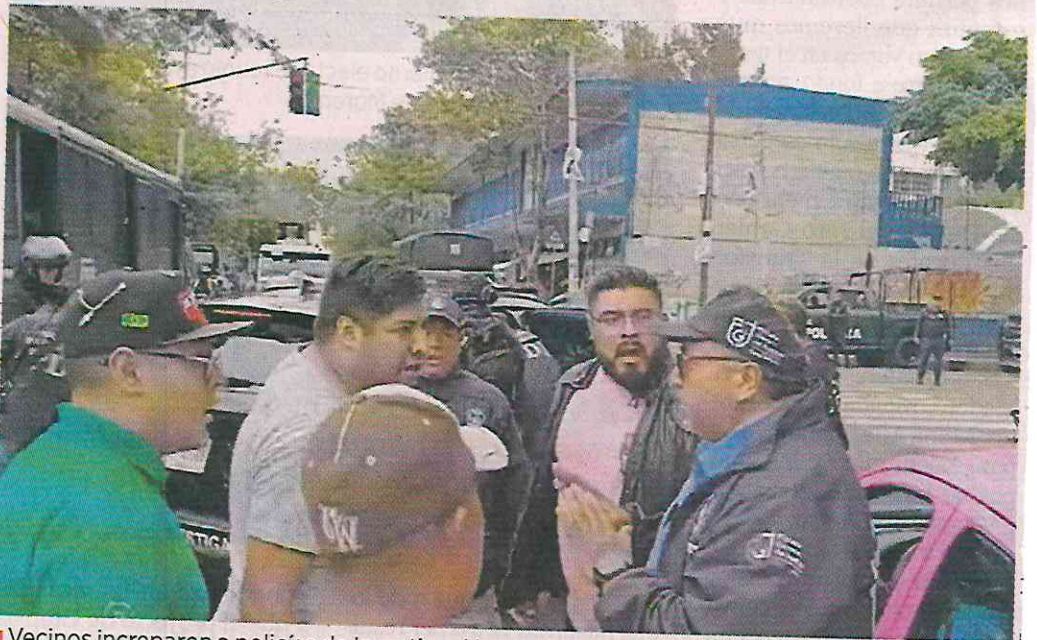
Vecinos increparon a policías de Investigación que habían detenido a dos sujetos.