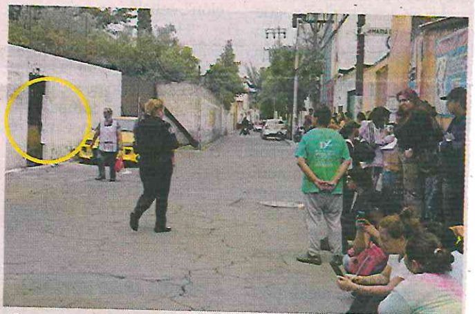
Personas afectadas por el desalojo permanecieron a las afueras del domicilio, al que se le colocaron sellos de la FGJ.