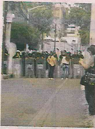
Granaderos de la SSC fueron desplegados para contrarrestar a los residentes.