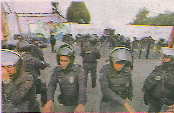
Más de un centenar de elementos de la SSC, junto a elementos de la Fiscalía, se presentaron en un predio para desalojarlo

Un representante legal de los vecinos señalan que ellos son dueños del predio desalojado, por lo es ilegal lo que están haciendo con ellos. Más de un centenar de elementos de la Secretaría de Seguridad Ciudadana de la Ciudad de México junto a elementos de la Fiscalía de Justicia se presentaron al predio en alcaldía Azcapotzalco