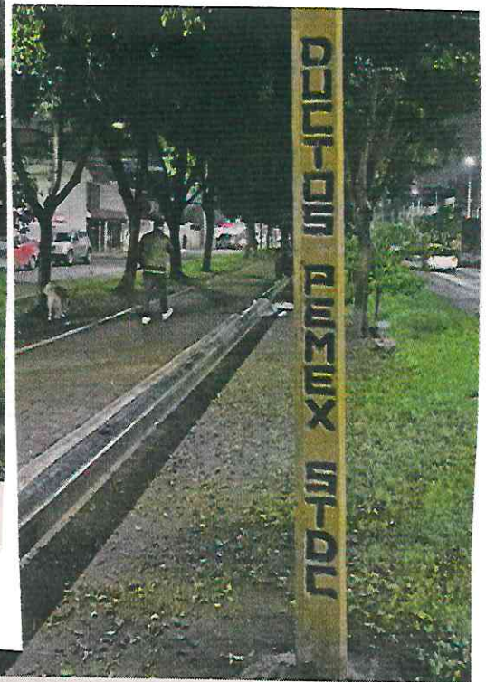
De acuerdo con ingenieros de Petróleos Mexicanos, la obra se realizará en los 5 kilómetros que recorren los ductos.