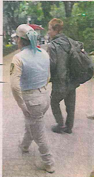
La mujer ya fue detenida, pero vecinos temen que quede libre.

“Yo tengo un perrito y siempre estoy en el parque, siempre estoy donde ella está, y obviamente me siento más