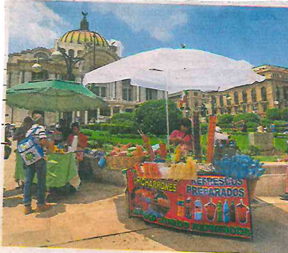
Los comerciantes instalados en la Alameda Central son controlados por dos grupos criminales rivales.

La injerencia de Los Palillos en por lo menos tres hechos violentos ha llevado a la Secretaría de Seguridad Ciudadana a realizar deten-