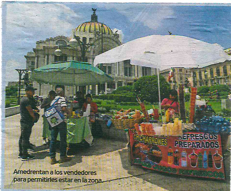
Amedrentan a los vendedores para permitirles estar en la zona