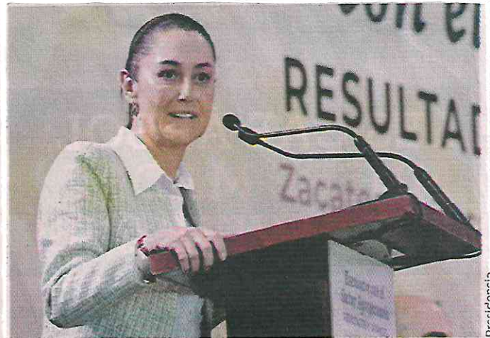
■ Claudia Sheinbaum realizó ayer una gira con el Presidente Andrés Manuel López Obrador por Zacatecas.

Por otro lado, el Presidente informó que planteará a la virtual Presidenta electa la posibilidad de continuar con el proceso de descentralización de las dependencias federales que inició en este sexenio.