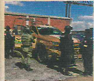
JULIO 4. Es asegurada una pipa en Tepeapulco, Hidalgo, con 29 mil litros de combustible.