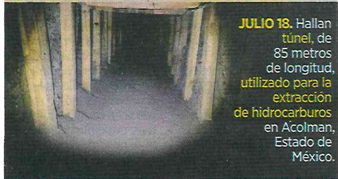
JULIO 18. Hallan túnel, de 85 metros de longitud, utilizado para la extracción de hidrocarburos en Acolman, Estado de México.

Algunos de los casos de huachicol registrados en este mes: