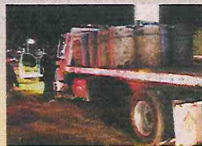
JULIO 5. Una bodega con al menos 8 pipas y unos 80 mil litros de combustible son localizados en Teoloyucan, EDOMEX.