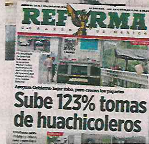
La megafuga de la gasolina, que alcanzó los 20 metros de altura, fue causada por huachicoleros.

Querétaro, entre otras situaciones delictivas y de riesgo para la población.