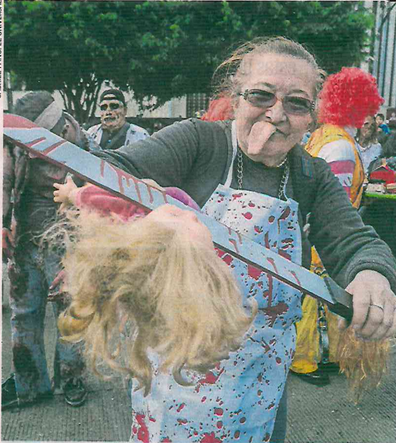
Tras los seres fantásticos y multicolores, los zombies salieron a las calles para asombrar y asustar a niños y adultos.