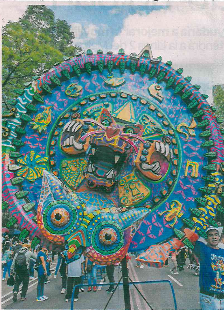
Al ritmo de la música, criaturas de colores vibrantes, formas exóticas y enormes dimensiones recorrieron Paseo de la Reforma.

“Yo trato de venir cada año desde que inició, porque siempre es muy bonito ver el talento y la creatividad que los mexicanos tenemos para ex-