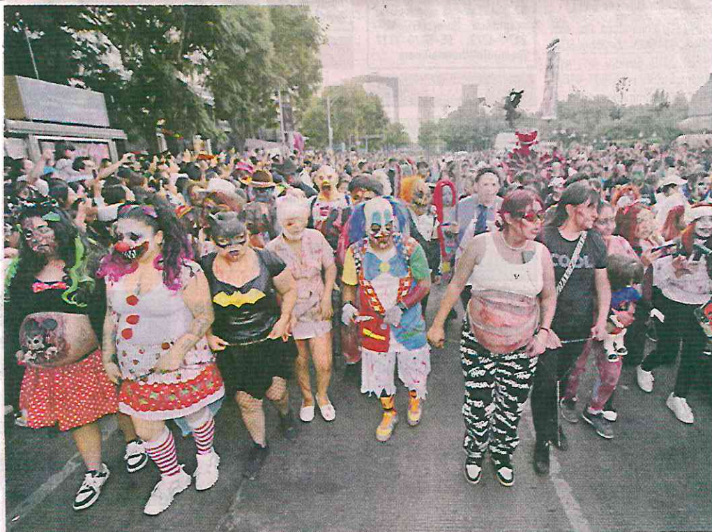
Los asistentes iban caracterizados de personajes de películas de terror y videojuegos.