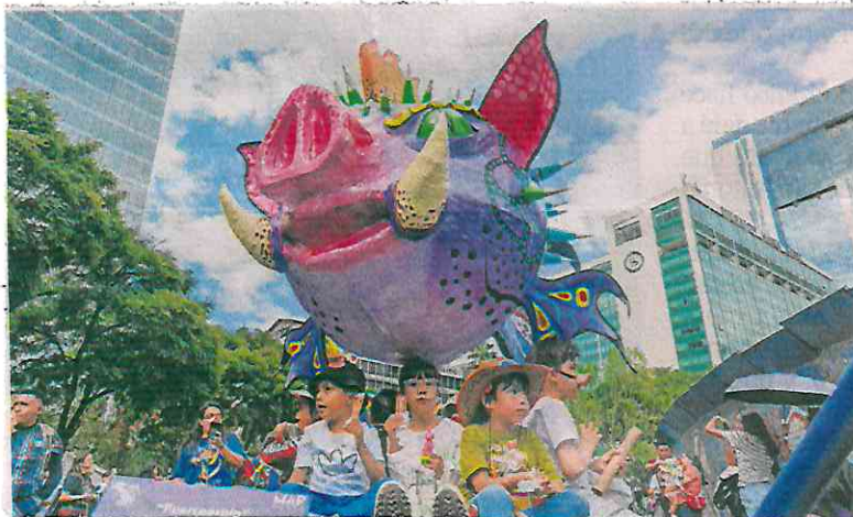
El alebrije Puercoespín estuvo acompañado por pequeños que no perdieron detalle de lo que ocurría sobre Reforma.