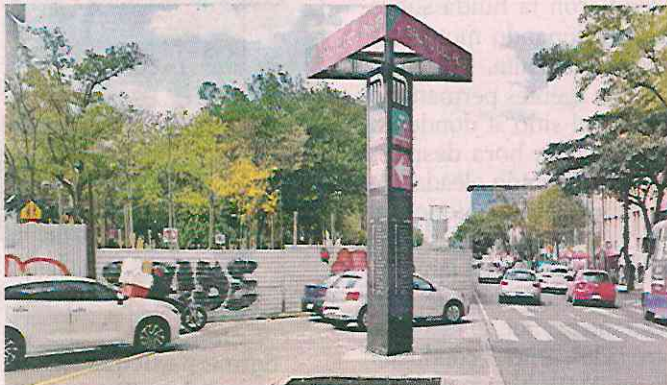
Las vallas fueron colocadas dos años atrás.