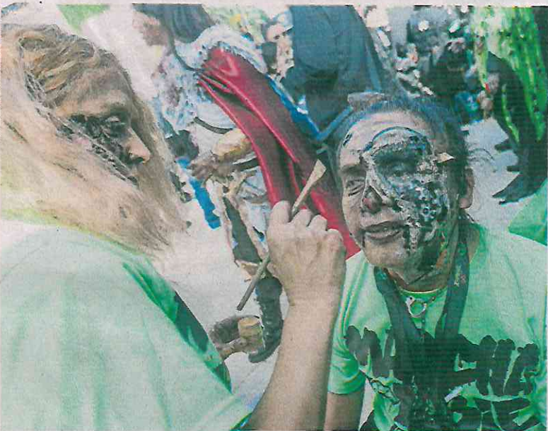
Una hora antes de que comenzara la marcha de los zombies, los participantes se concentraron en la Plaza de la República para maquillarse.