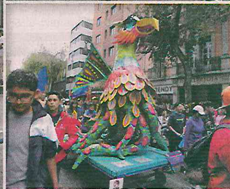
De acuerdo con la Secretaría de Cultura capitalina, en el desfile participaron 185 alebrijes.