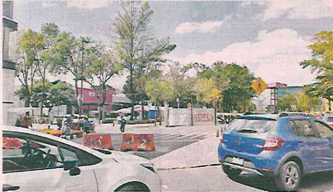
El muro de láminas provoca tráfico vehicular.