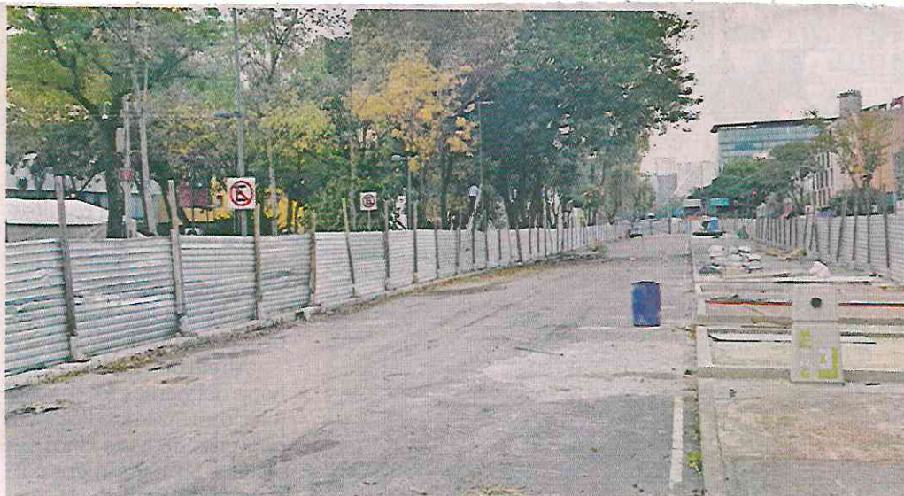
Pese a que ya no se realizan obras por la L-1, un tapial se mantiene en Avenida Arcos de Belén.