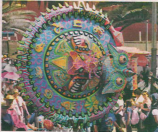
■ Artesanos cruzaron el País para participar en el Desfile de Alebrijes Monumentales

■ Ya son 11 años que venimos participando, ahora nos inspiramos en estos gallos y le pusimos ese nombre porque es un decir que hay allá de donde venimos".