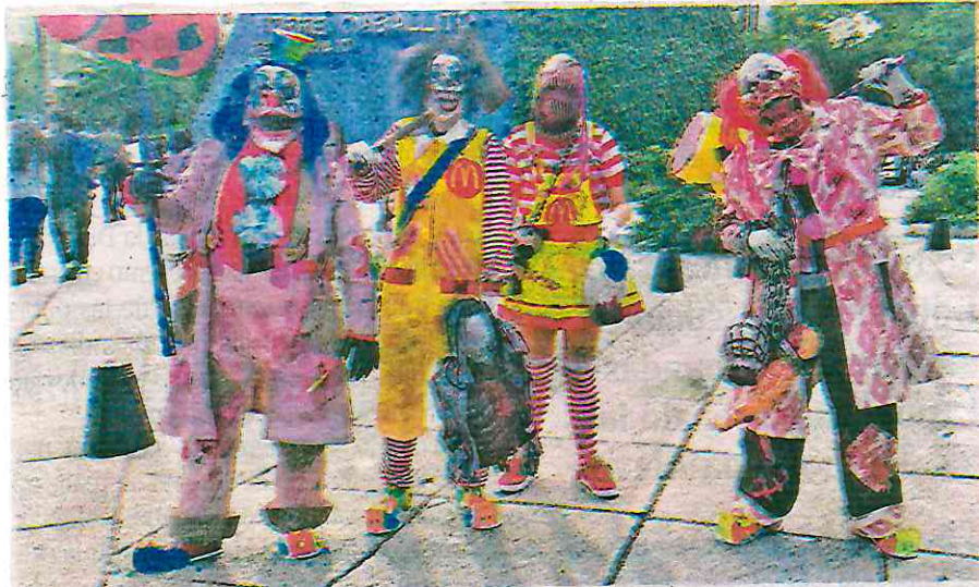
La Marcha Zombie empezó su recorrido a las 16:00 horas del Monumento a la Revolución hasta arribar al Zócalo capitalino