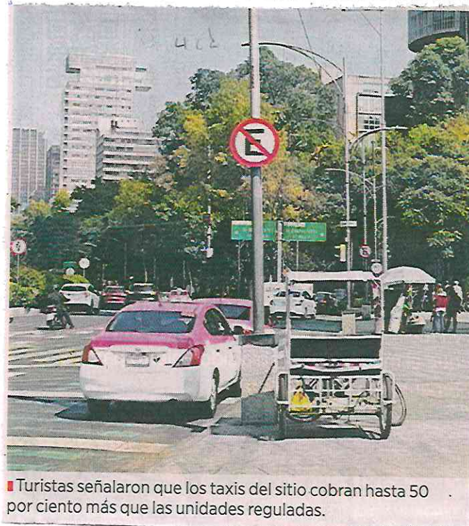
■ Turistas señalaron que los taxis del sitio cobran hasta 50 por ciento más que las unidades reguladas.

“Además, los taxis que se paran acá nunca tienen sus papeles en orden, no traen licencias o el tarjetón a la vista y tienen que tapar las placas para evitar las multas, pero ya están bastante asentados, porque, por más que los quitan, siempre tardan un par de días en regresar”.