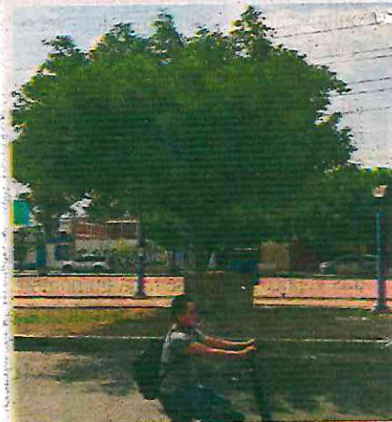
Personal especial debe hacer la poda