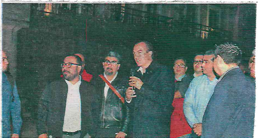
El alcalde se dijo entusiasmado por la llegada de una primer Utopía a Cuajimalpa

Orvañanos recalcó que este tipo de proyectos favorece la convivencia y coad-