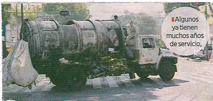
Algunos ya tienen muchos años de servicio.

“Los vehículos eléctricos pueden ser una solución muy interesante para áreas en condiciones de dificultad de acceso o en zonas como el Centro Histórico”, dijo la especialista.