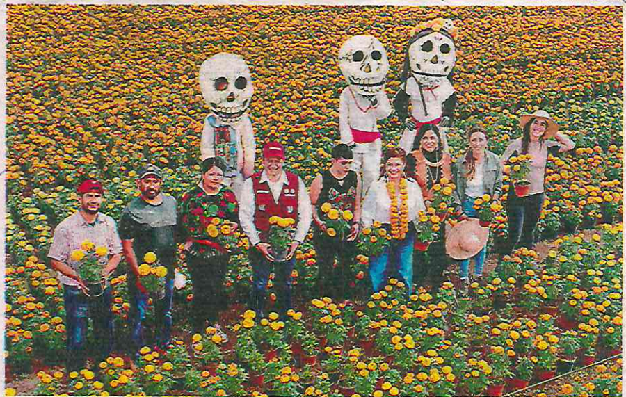
Llaman a las y los capitalinos a comprar en Xochimilco la flor del Día de Muertos

"Tenemos que apoyar a los productores que sufren ante las tormentas de agua, las heladas, la sequía, que sufren con las