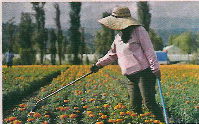
Ayer comenzó la venta de flores de cempasúchil en la Capital.

Ustedes van a tener a ese parque siempre con las plantas de temporada que aquí se producen y van a vigilar que esté verde, que no se marchite, que se riegue”.