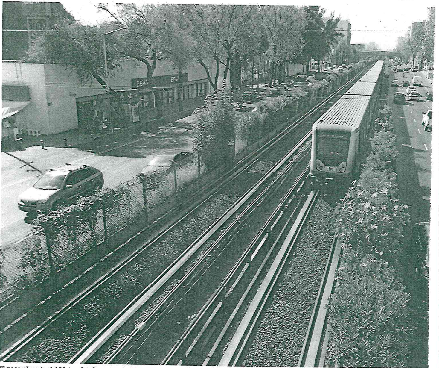
El paso elevado del Metro donde se pretende construir una ciclovía correría de San Antonio Abad a Tasqueña.