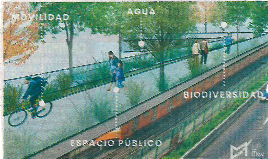
Laboratorio de Movilidad realizó una proyección de cómo sería usado por peatones y ciclistas.