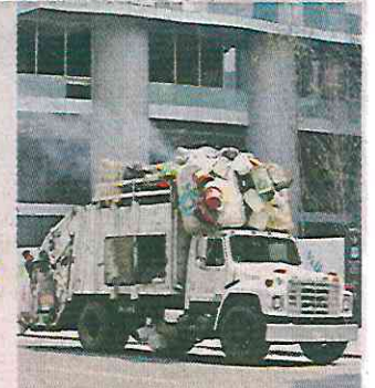
La mayoría de camiones no está en buenas condiciones.

Entre las demarcaciones con más camiones contaminantes están la GAM e Iztapalapa, las Alcaldías más pobladas de la Capital.