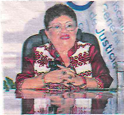
Será a distancia, con unos panistas que acusan persecución para que se le ratifique