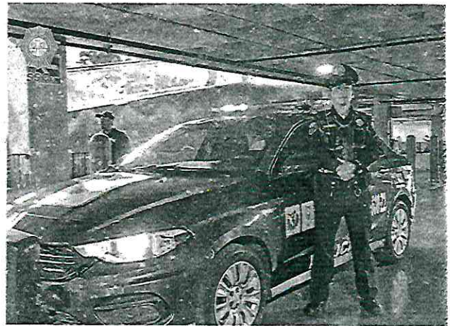
Desplegados 14 mil 867 policías capitalinos, principalmente en plazas y centros comerciales de las 16 alcaldías, en el marco del operativo del Buen Fin