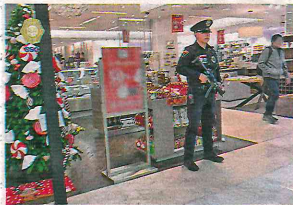
Operativo de vigilancia durante el Buen Fin 2023

A los usuarios se les sugiere establecer contraseñas sólidas que incluyan números, signos, letras mayúsculas y minúsculas, para evitar que sean descifradas con facilidad por ciberdelincuentes, así como ignorar mensajes vía SMS que hagan mención de un falso cargo. En dicho caso deberán comunicarse directamente con la institución bancaria correspondiente.