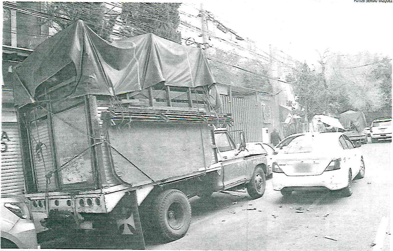
Estas unidades, cuando están en la vía pública, propician zonas de inseguridad y generan rencillas todos los días, porque regularmente estorban en el acceso a las casas habitación o a los fraccionamientos