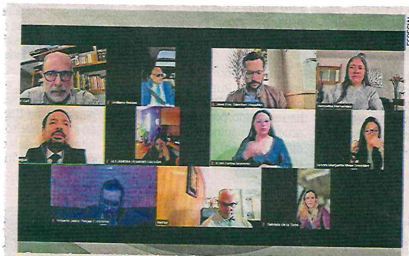
El CJC realizó una reunión virtual en la que se seleccionó a las personas que pasaron a la siguiente fase para ocupar las fiscalías especializadas.