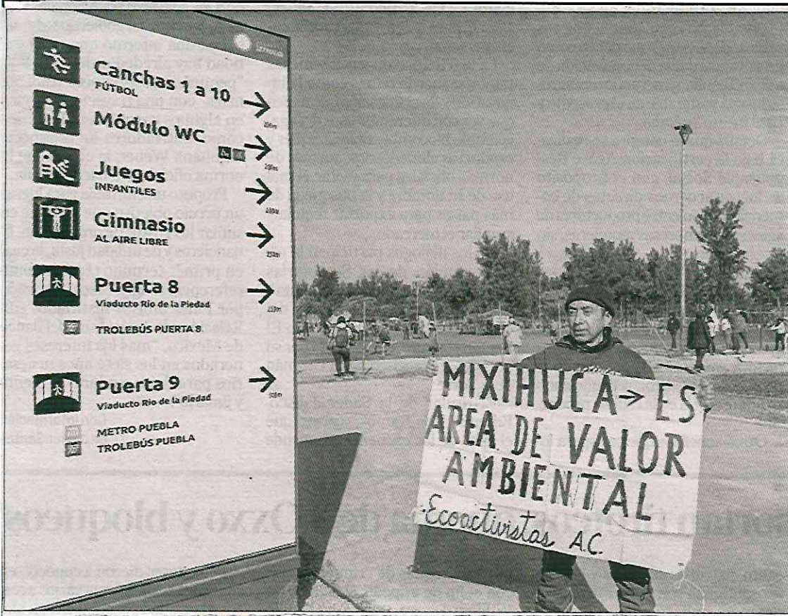
◀ Usuarios de las diferentes áreas de la Magdalena Mixiuhca piden que vuelva a ser área de valor ambiental.