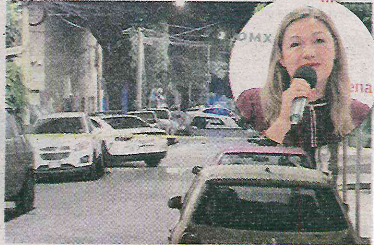
El delito con más alta peligrosidad fue la violencia familiar

Se cometieron mil 496 delitos en Azcapotzalco de octubre a noviembre del año pasado, un dos por ciento más que durante la anterior administración