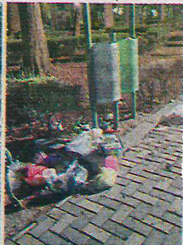
El descuido en la demarcación genera malestar ciudadano