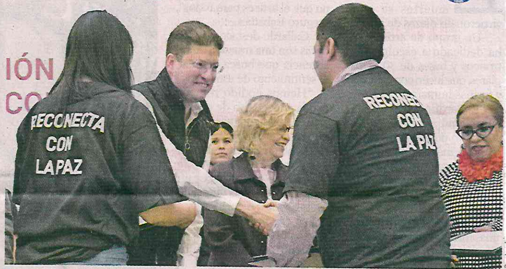
Los titulares de la SSC y de la Secretaría de Gobierno de la CDMX reconocieron a 93 jóvenes que cursaron Reconecta con la Paz.