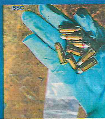
Fuerte golpe a la delincuencia organizada luego de asegurar 550 toneladas de autopartes y dos armas de fuego cortas