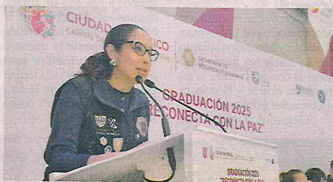
La ceremonia de graduación del programa se realizó en el Museo del Policía.

“Para sus seres queridos, para las instituciones públicas, sería maravilloso verlos mañana que vinieran con la con la gente del programa y le dijeran: ‘aquí está mi diploma porque ya aca-