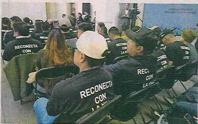
Los participantes tienen 10 veces menos posibilidades de reincidir, según autoridades.

bé la Prepa’, ‘ya acabé la Universidad’.