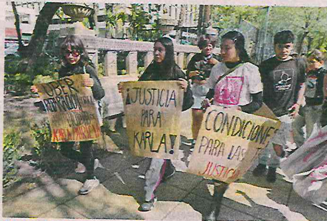
RECLAMO. El lunes, familiares y conductores reclamaron justicia por el caso.