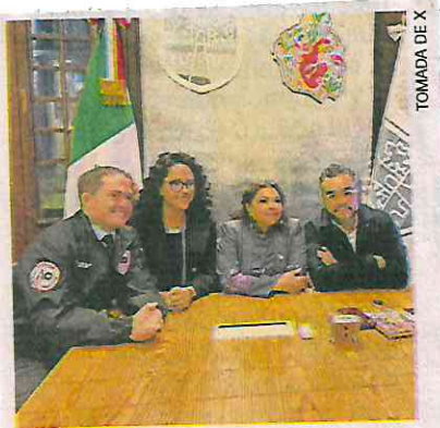
La jefa de Gobierno se reunió con los ediles de M. Contreras, Tlalpan y ÁO.

En 2026 se contempla iniciar la línea que estará en Xochimilco. ●