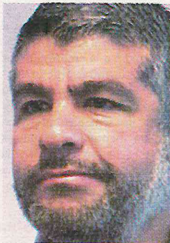
El edil se habría beneficiado

Un abogado señaló que el esquema utilizado es similar al que usó el Cártel Inmobiliario