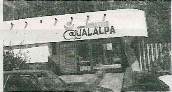
Las instalaciones están vandalizadas

Este diario encontró que el lugar está físicamente dete-