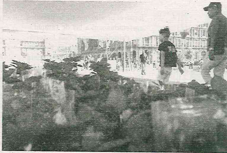
Actualmente en San Gregorio solo hay tres productores

Ella es una de los muchos productores de Xochimilco que ya no cultivan la nochebuena debido a que es una planta que requiere de cuidados que no favorece el suelo chinampero.