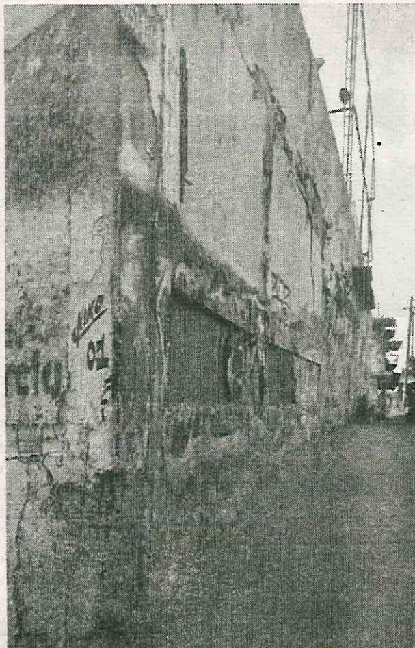
Varias denuncias se han presentado últimamente

Las autoridades a las que se le pide atención antes de que co-